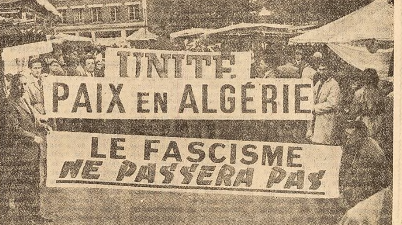
În Franța se intensifică acțiunile de protest ale maselor împotriva atentatelor puse la cale de către elementele ultracolonialiste. Fotografia de mai sus înfățișează un aspect din timpul manifestației care a avut loc recent la Puteaux. Demonstrații purtau lozinci ca: „Paace în Algeria!”, „Fascismul nu va trece”

Partidul Comunist din Algeria salută toate dovezile de solidaritate cu oamenii muncii algerieni din partea oamenilor muncii francezi și a organizațiilor lor și, în primul rînd, din partea Confederației Generale a Muncii și a Partidului Comunist Francez. Declarația îndeamnă la organizarea unor manifestări de masă ale poporului algerian. Ea recomandă îndosebi ca la 1 noiembrie să se organizeze Ziua națională de luptă pentru independență, pentru a determina Franța să înceapă tratative imediate și cu toată seriozitatea, pentru ca măsurile rasiale care au fost luate împotriva oamenilor muncii algerieni să fie anulate fără întîrziere.