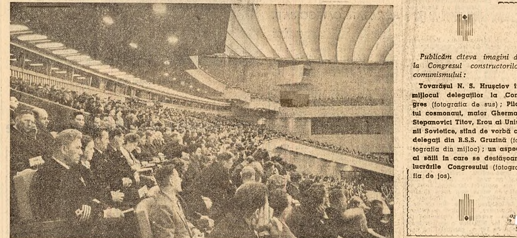
Publicăm câteva imagini de la Congresul constructorilor comunismului: Tovarășul N. S. Hrușciov în mijlocul delegațiilor la Congres (fotografia de sus); Pilotul cosmonaut, maior Gherman Stepanovici Titov, Erou al Uniunii Sovietice, stînd de vorbă cu delegații din R.S.S. Gruzină (fotografia din mijloc); un aspect al sălii în care se desfășoară lucrările Congresului (fotografia de jos).