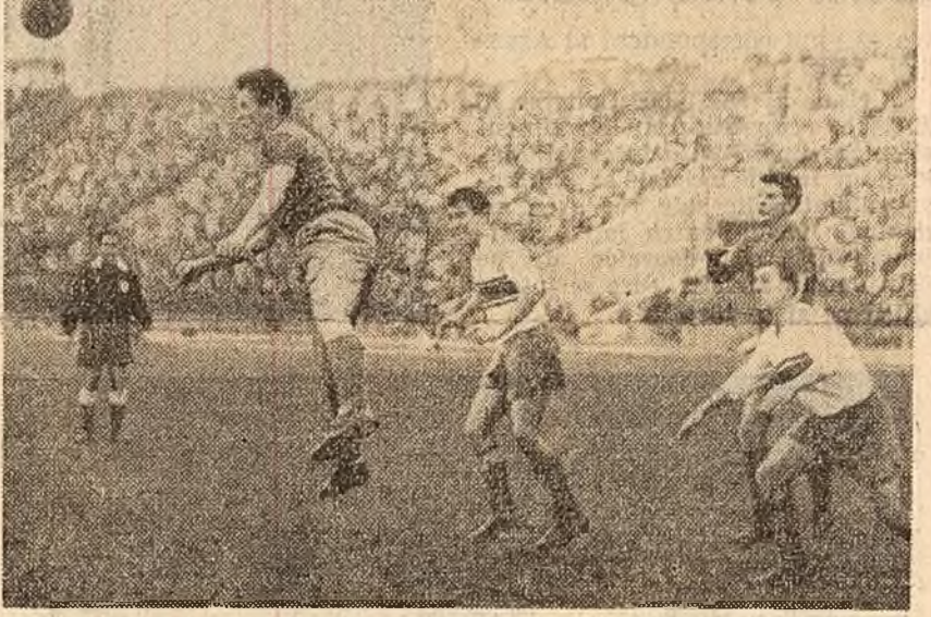
Fază din meciul Rapid-C.C.A.

Seria I-a: C.S.M.S. Iași — Rapid Focșani 2-1; Szeuaua roșie Bacău — Știința Galați 1-0; Ceabăușul P. Neamț — Carpați Sinaia 3-2; Dinamo Galați — C.S.M. Brăila 1-1; Flacăra Moreni — Prahova Ploiești 1-1; C.F.R. Pașcani — Foresta Fălcișeni 1-0; Dinamo Suceava — Poiana Cimpina 1-2.