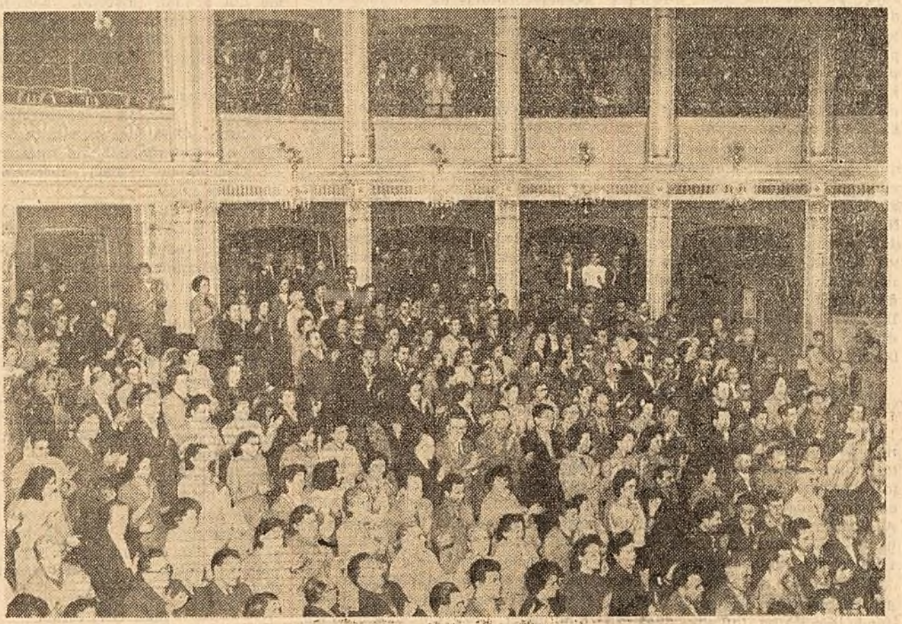
Aspect de la mitingul oamenilor muncii din raionul Lenin din Capitală

Participanții la miting au ovăționat pentru Partidul Comunist al Uniunii Sovietice, pentru Partidul Muncitoresc Român, pentru prietenia și solidaritatea frățească de nezdruincat care unesc popoarele romîni și sovietici.