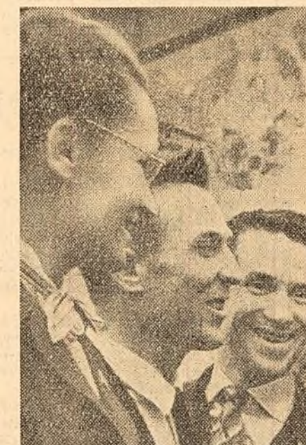
Erul Uniunii Sovietice A. P. Maresov, printre delegații la Congresul al XXI-lea al P.C.U.S.