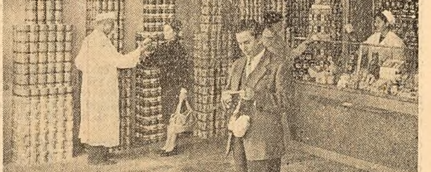
Noul magazin alimentar este una din numeroase unități comerciale moderne puse la dispoziția cetățenilor din cartierul Giulești. În fotografie: Un aspect din interior.

Congresul al XXII-lea al Partidului Comunist al Uniunii Sovietice a afirmat că sistemul socialist mondial nu doare războiul, că este convins de victoria so-