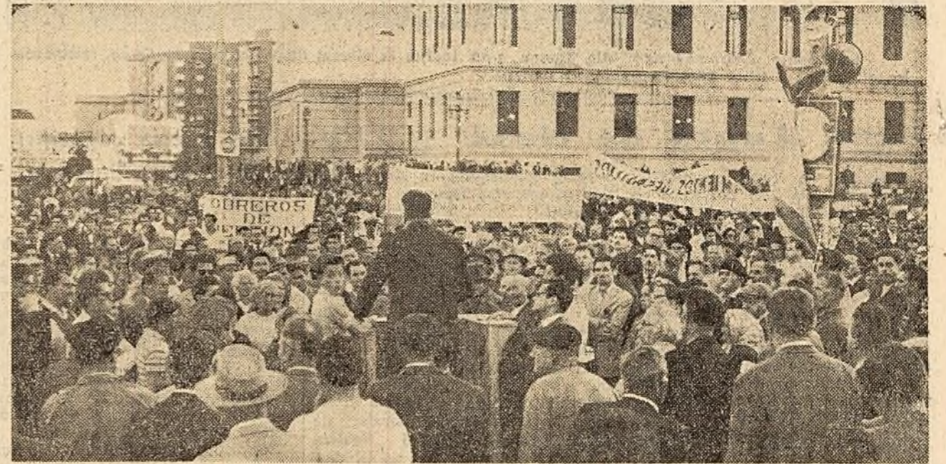
MONTEVIDEO. Un miting de solidaritate cu muncitorii greviști.