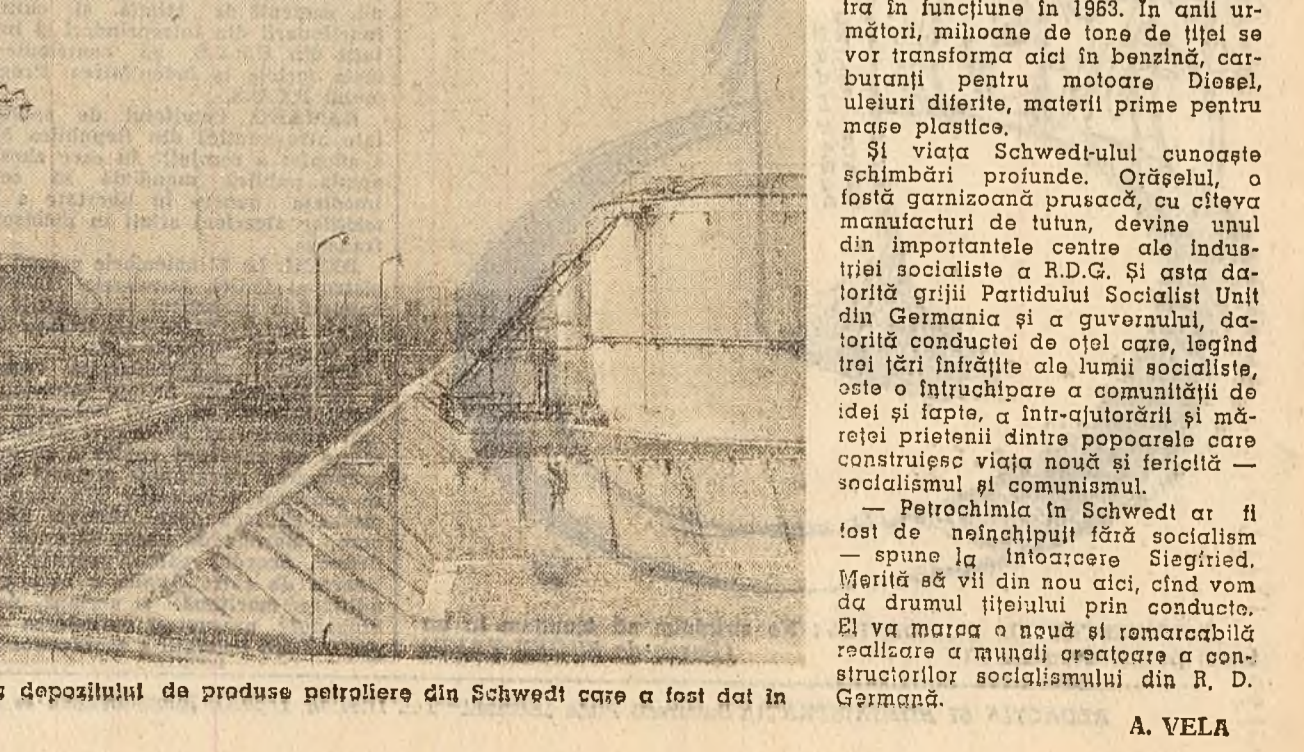
Vedere generată a primei părți a depozitului de produse petroliere din Schwedt care a fost dat în folosință cu 2 ani înainte de termen.

— 1.800 km.). De curând, tehnicienii din R.D.G. și R. P. Polonă au așezat în patul său din albia Oderului, conducta de legătură care unește traseul polonez cu cel german. Făcînd spre Schwedt o călătorie de 28 de zile, prin conducte cu un diametru de 600 mm., petrolul se va scurge cu o viteză de 5,5 km. pe oră: în fiecare minut este 8 tone petrol. „Aurul negru” va fi împins de puterile stațiilor de pompare care vor consuma anual tot atîta energie electrică cît este necesară, de pildă, unui oraș mare ca Leipzig. Conducta este arta dădătoare de viață a întregului combinat de la Zosa. Ea va da R.D. Germane, alături de cărbunele autohton, cea de a doua bază de materii prime