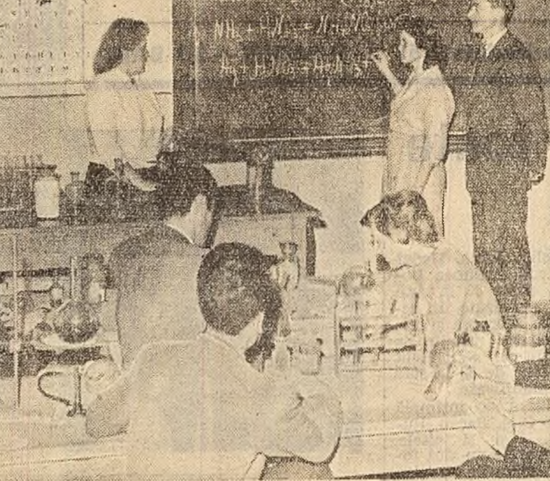
La o lecție recapitulativă de chimie de la Școala medie nr. 18 „M. Eminescu”, secția școlară din Capitală...