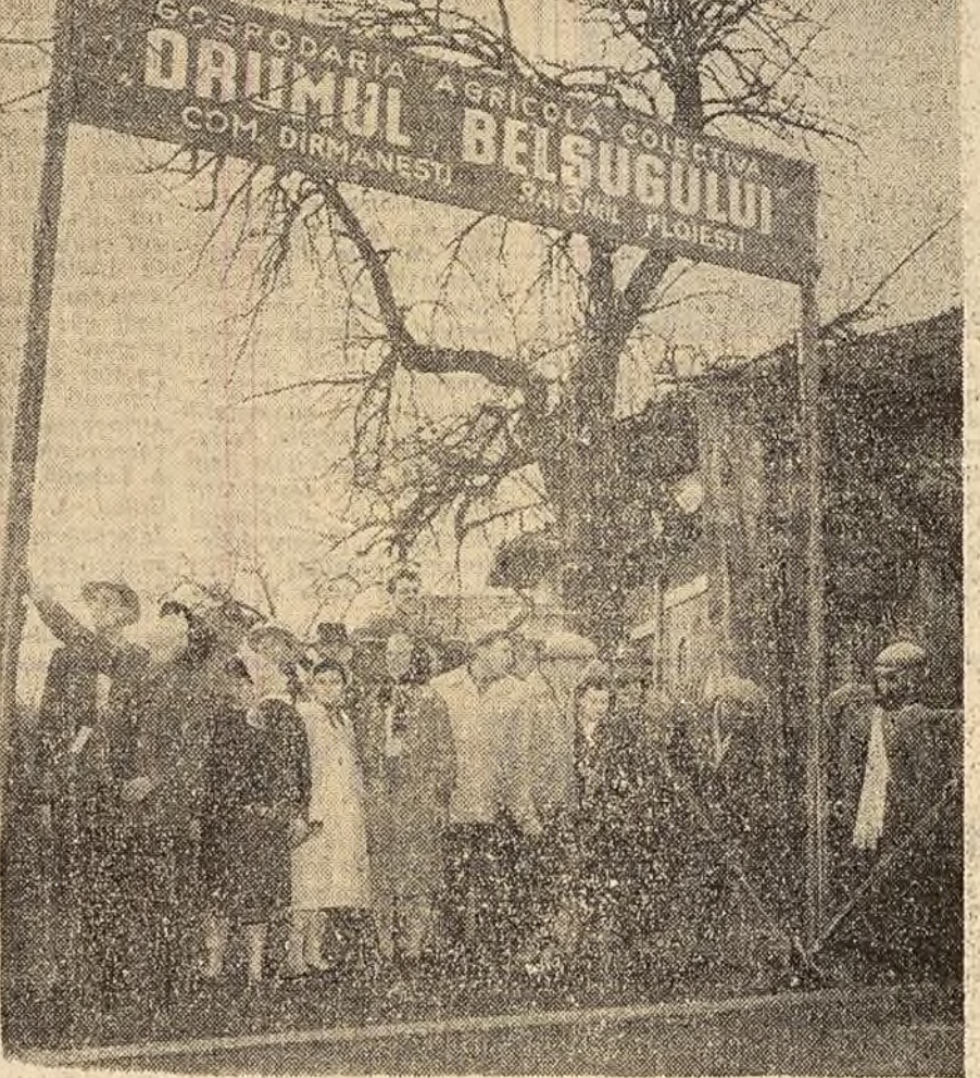
Aici va fi sediul gospodăriei colective.