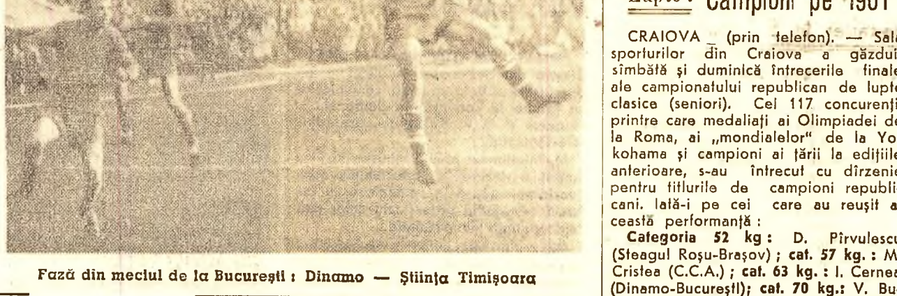
Fază din meciul de la București: Dinamo — Știința Timișoara