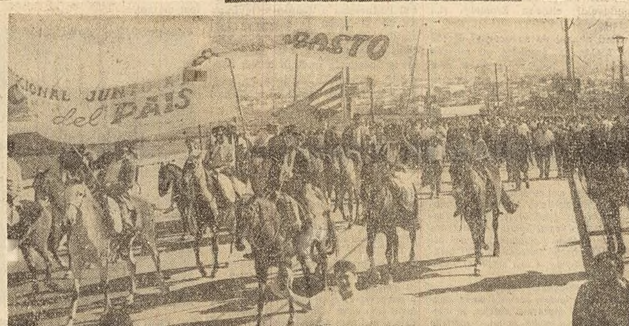
O demonstrație de protest în Uruguay a avut loc o grevă generală în semn de solidaritate cu muncitorii greviști din Australia cărora în fotografia în grup de muncitori care au pornit în marș spre palatul legislativ din Montevideo pentru a protesta împotriva concedierii lor.

În răspunsul dat Biroului Telegrafic Finlandez V. Tanner, președintele Partidului social-democrat din Finlanda, a fost nevoit să recunoască că rezultatele convorbirilor de la Novosibirsk între U. K. Kekkonen și N. S. Hrușciov sînt liniștitoare.