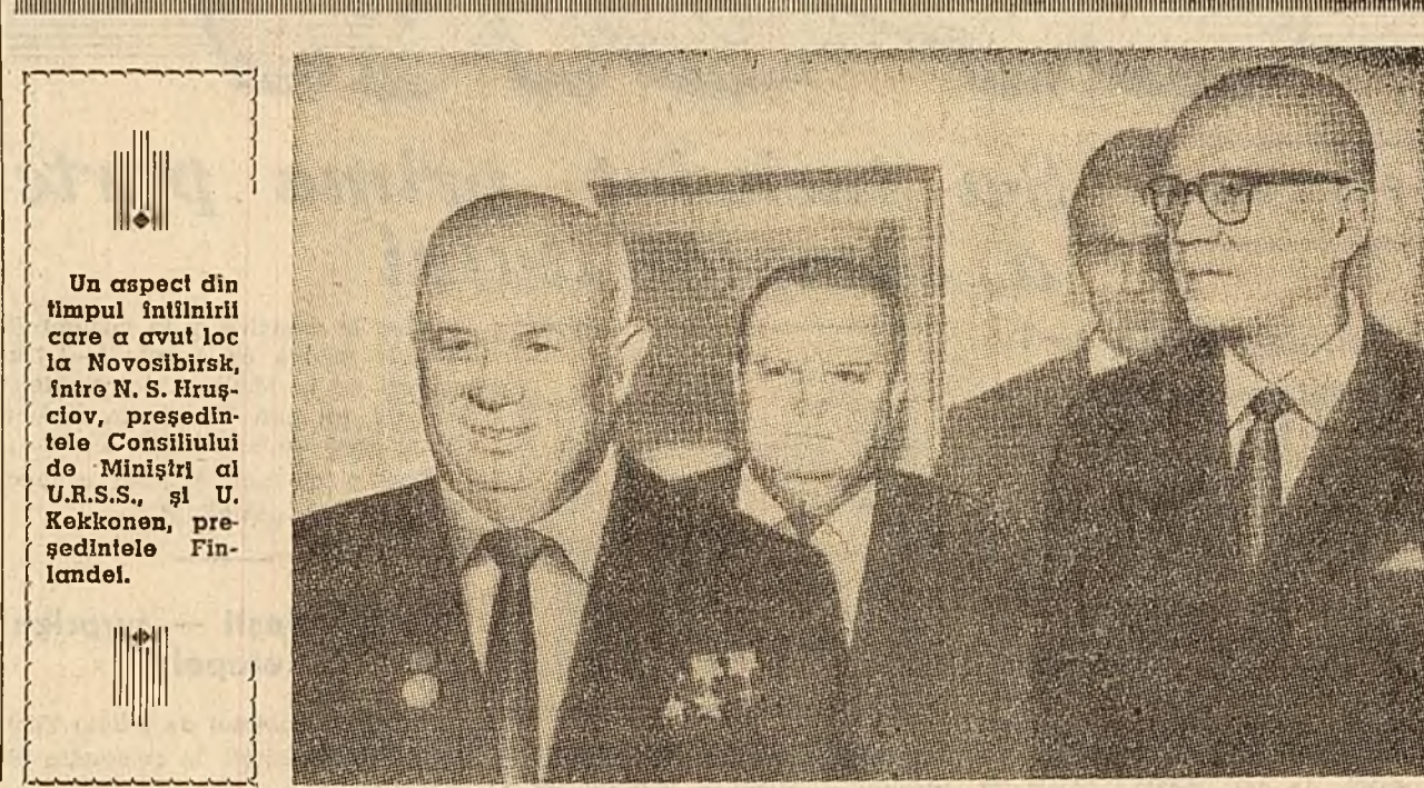
Un aspect din timpul intilnirii care a avut loc la Novosibirsk, între N. S. Hrușciov, președintele Consiliului de Miniștri al U.R.S.S., și U. Kekkonen, președintele Finlandei.

Președintele Finlandei despre convorbirile de la Novosibirsk