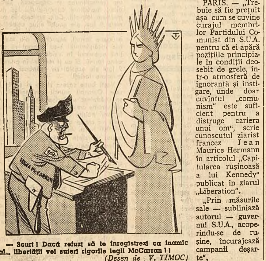
— Scuti! Dacă refuz să te înregistrez ca înamic al libertății vei suferi rigoriile legii McCarran! (Desen de V. TIMOC)