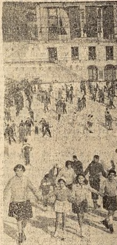
Cald, sanin. Așa a fost ieri în Capitală. Totuși, amatori de peșci cu țesături pe gheață. Pe lângă artiștii din parcul „23 August” le-a stat la dispoziție.

În cadrul grupului școlar petrochimic de la Borzești au fost pregătiți în ultimii ani peste 400 de muncitori calificați în meseriile de operatori-chimici și mecanici pentru aparate de măsură și control. Anul acesta, a terminat cursurile prima promoție de maistri-chimici în domeniul fabricării cauciucului sintetic. De curând, la Onesti a fost dată în folosină pentru elevii claselor I-VII și pentru cei de la cursul seral o nouă școală cu 16 săli de clasă.