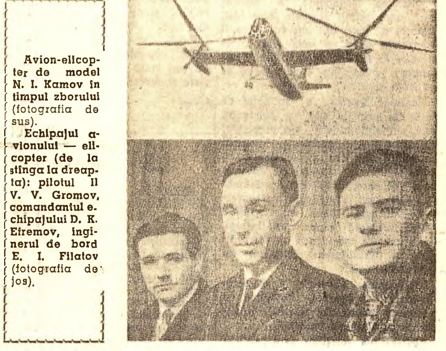
Avion-elicopter de model N. I. Kamov în timpul zborului (fotografia de sus).