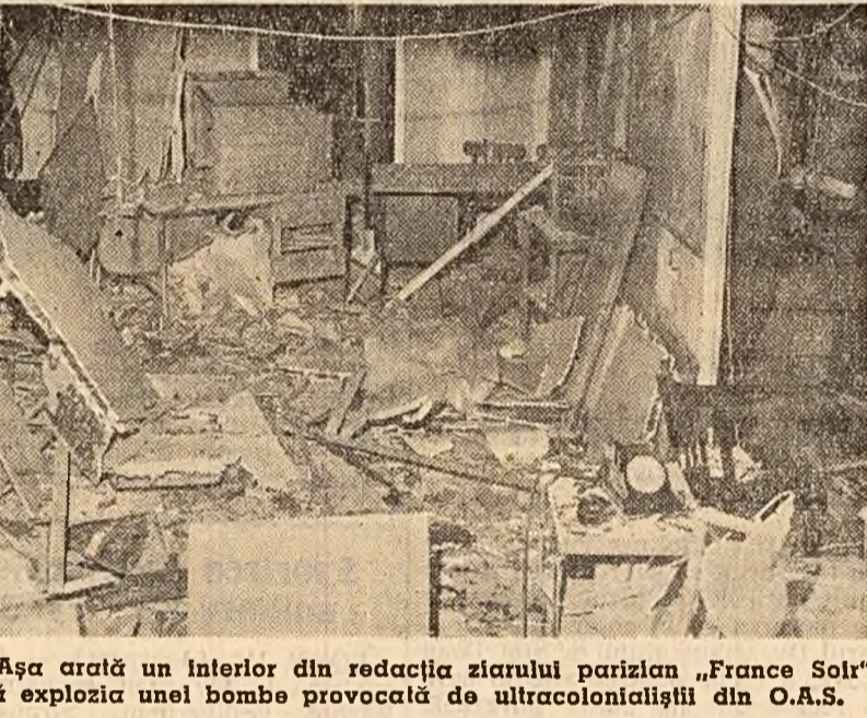
Așa arată un interior din redacția ziarului parizian „France Soir” după explozia unei bombe provocată de ultracolonialismul din O.A.S.