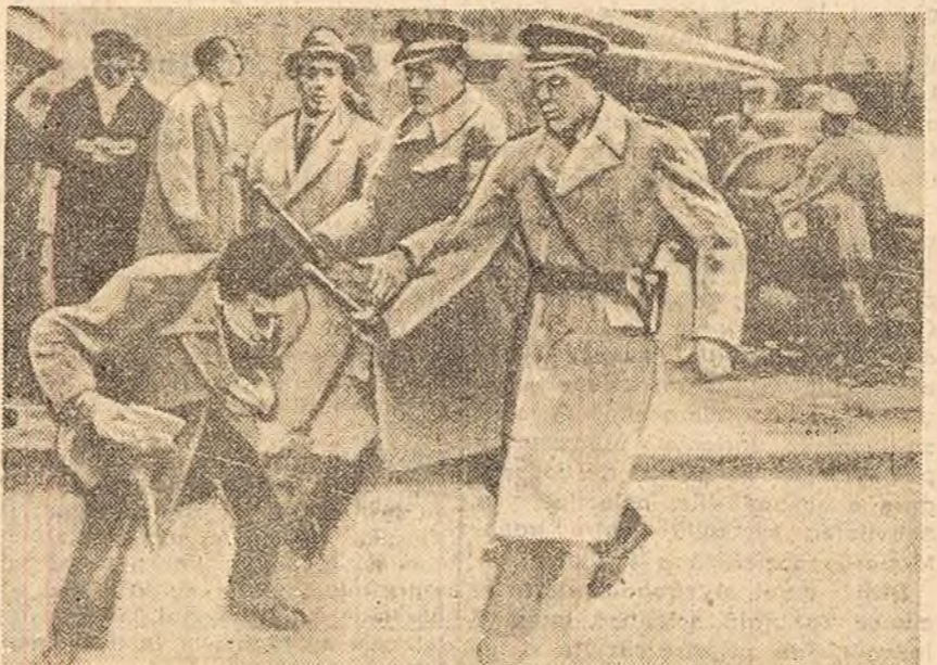
MILANO. Un fotoreporter italian a încercat să lăcească o fotografie „culezătoare”: poliția folosind jerturi de apă împotriva unei demonstrații a țărănilor. Pentru această poliștiștii l-au bătut cu bastoane de cauciu.

Noile incidente, menționează agenția ADN, trebuie considerate în strînsă legătură cu ultimele cereri ale primarului Berlinului occidental, Brandt, care a chemat la distrugerea instalațiilor de apărare de la frontiera de stat a R.D. Germane.