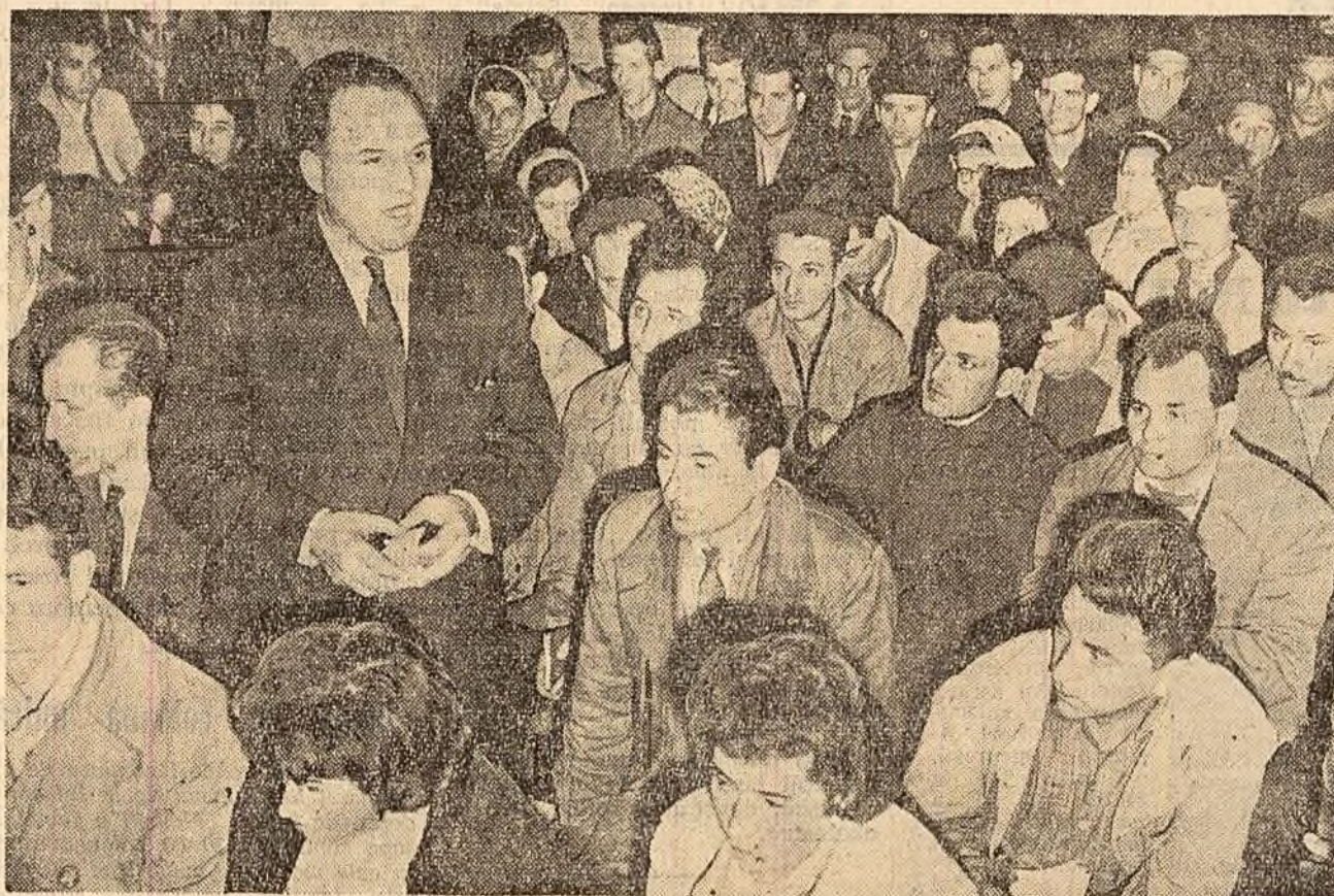
Aspect de la adunarea de dezbateri a cifrelor de plan pe 1962 în secția turnătorie.