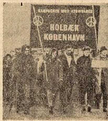
Danezi într-un marș organizat împotriva instalării de baze atomice și a „colaborării” militare cu Bonn-ul.