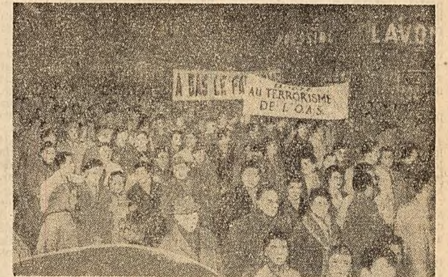
Ziua de 19 decembrie a fost declarată în întreaga Franță zi de luptă împotriva organizației teroriste O.A.S. În toate orașele țării au fost organizate demonstrații pentru condamnarea fascistilor din O.A.S.