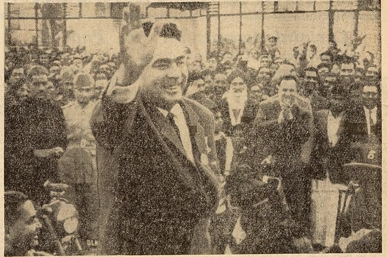
Populația orașului Delhi a făcut o primărie călduroasă lui L. I. Brejnev, președintele Prezidiului Sovietului Suprem al U.R.S.S., cu prilejul vizitei sale în India. La 23 decembrie, L. I. Brejnev a vizitat termocentrala electrică de la Neivell, construită cu ajutorul U.R.S.S.