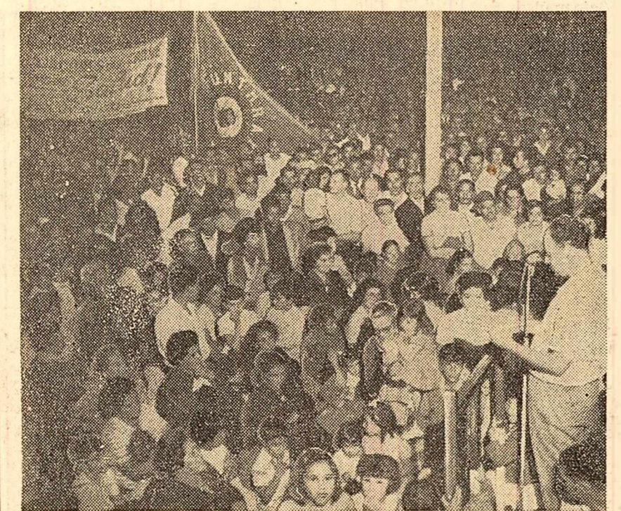
URUGUAY. — Datorită luptei lor perseverente, muncitorii din Industria cărămii au reușit să obțină repămirii în întreprinderi a tovarășilor concediați în mod abuziv de patroni. În fotografie: Aspect de la mitingul care a avut loc la Montevideo cu prilejul acestei victorii a muncitorilor.

PARIS 19 (Agerpres). — La 18 aprilie, în Palatul Elysee, a avut loc prima ședință a guvernului Pompidou. Una din principalele probleme discutate la ședința Consiliului de Miniștri a fost situația din Algeria, unde bandele fasciste ale O.A.S., cu ajutorul terorii sîngeroase, încearcă să zădărnicească transparența în viață a acordurilor de la Evian. Louis Joxe, ministru fără portofoliu pentru problemele Algeriei, a făcut o expunere cu privire la situația din Algeria. Consiliul de Miniștri a adoptat hotărîrea cu privire la numirea generalului Fourquet în postul de comandant-șef al forțelor armate franceze în Algeria, înlocuind pe generalul Ailleret în acest post.