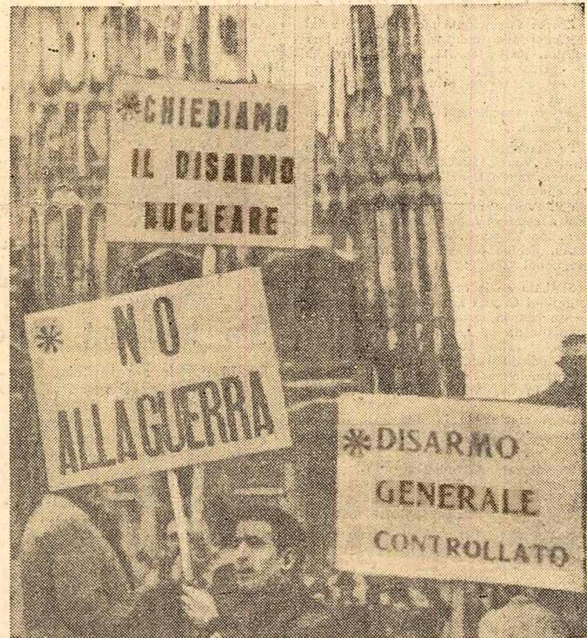
Demonstrația a partizanilor păcii la Milano

LEOPOLDVILLE. Chombe, care a dus tratative cu primul ministru congolez, Adouk, a fost transportat cu un elicopter al O.N.U. la aeroportul Ndjili, pentru a se re-