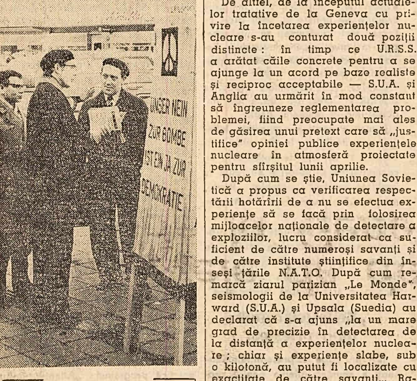
În orașul vest-german Rüsselsheim, partizanii ai păcii împart albe trecătoare, îndemnându-i să participe la tradiționalul marș împotriva înarmării atomice a R.F.G.

Practic orice explozie experimentală în U.R.S.S., ci o și pot localiza chiar cu exactitate — în timp ce militarii au convins guvernul american că o sistare a experiențelor atomice este acceptabilă numai dacă sovieticii vor admite un control internațional? Dar fiind că susținătorii unui sistem de control au știut de mult că Hrușcov nu va admite acest control, ei au subminat cu bună știință încheierea unui acord asupra interzicerii experiențelor atomice.