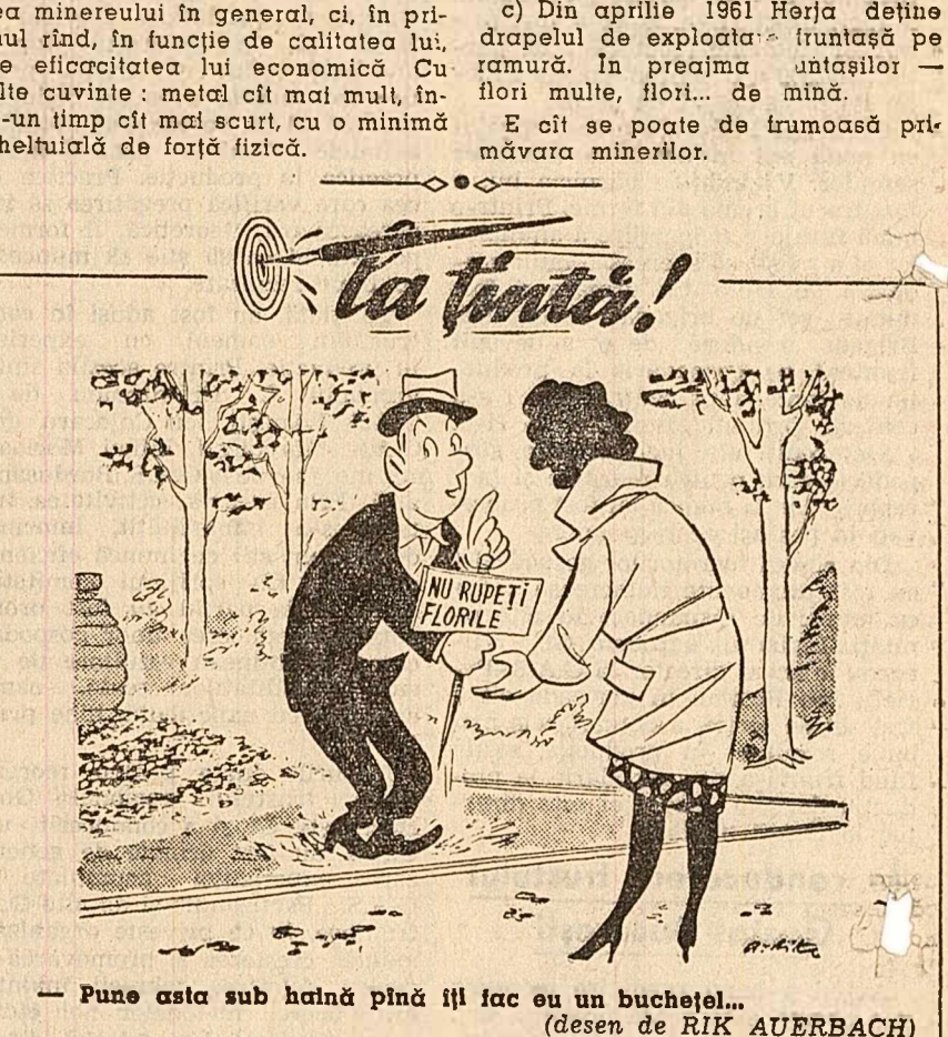
Pune asta sub haină pînă îți fac ou un buchețel... (desen de RIK AUERBACH)