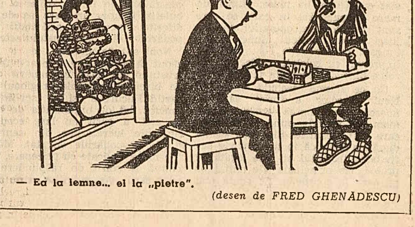
Ea la lemne... ei la „pietro”. (desen de FRED GHENĂDESCU)