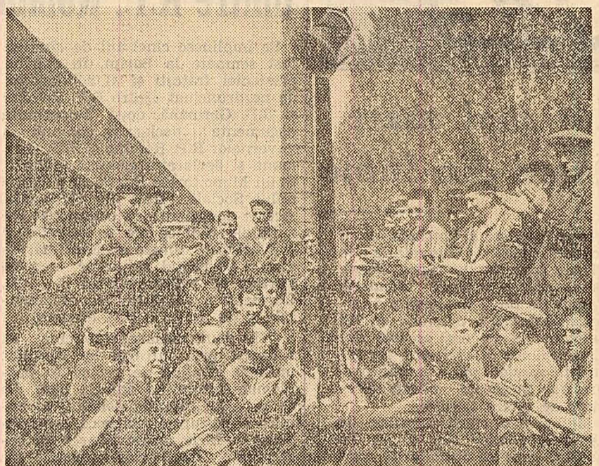
Uzine „Republica” din Capitală. În jurul megafonului numeroși muncitori din diferite secții ascultă într-o pauză Raportul prezentat de tovarășul Gh. Gheorghiu-Dej la sesiunea extraordinară a Marii Adunări Naționale.

Mulți cetățeni care lucrează în orele de după-amiază au stat ascăsuți în fața televizoarelor și a aparatelor de radio. În centrul orașelor, cum ar fi de pildă la Brașov în piața „23 August” și pe strada Republicii, sute de cetățeni s-au grupat în jurul difuzoarelor. Cu multă atenție au ascultat pașajele despre agricultură, muncitorii din diferite secții au ascultat tovarășul Gh. Gheorghiu-Dej la sesiunea extraordinară a Marii Adunări Naționale.