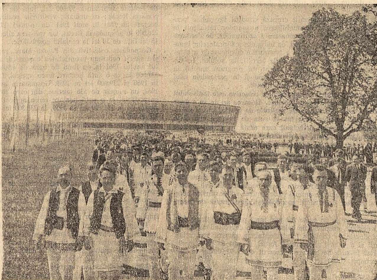
După terminarea ședinței de dimineață