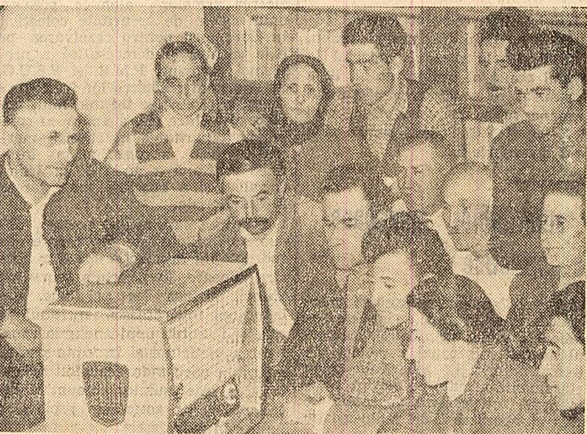
La colțul roșu al gospodăriei colective „Viața nouă” din comuna Bărcănești, regiunea Ploiești.