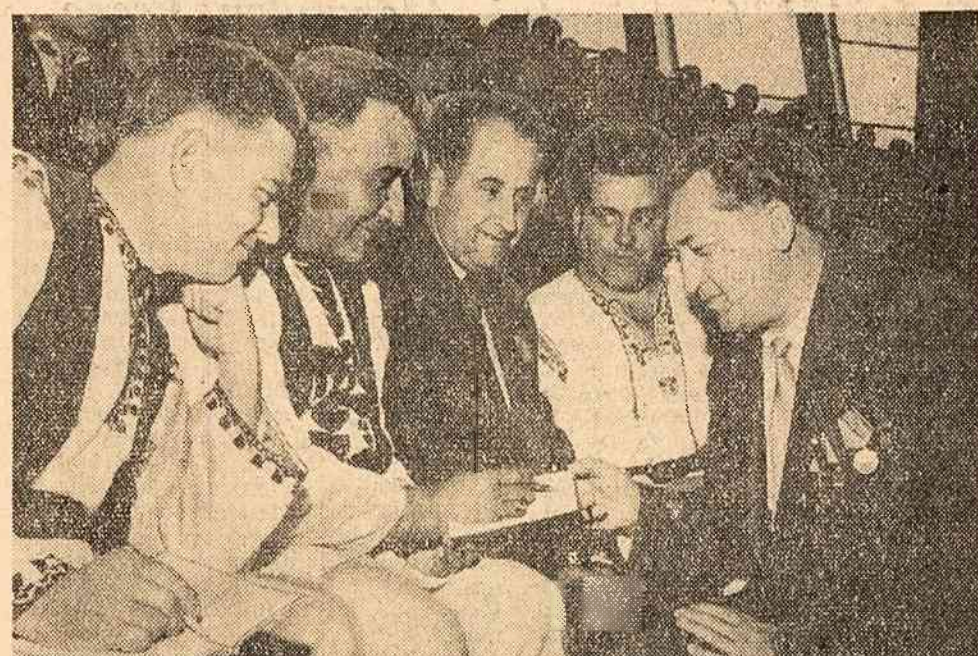
Un grup de invitați din regiunea Hunedoara

Cu sprijinul consiliului de conducere am organizat din primul an un lot demonstrativ de 40 ha pentru porumb. Acest lot l-am îngrășat cu gunoal ce fusese aruncat la marginea satului, administrînd cîte 20