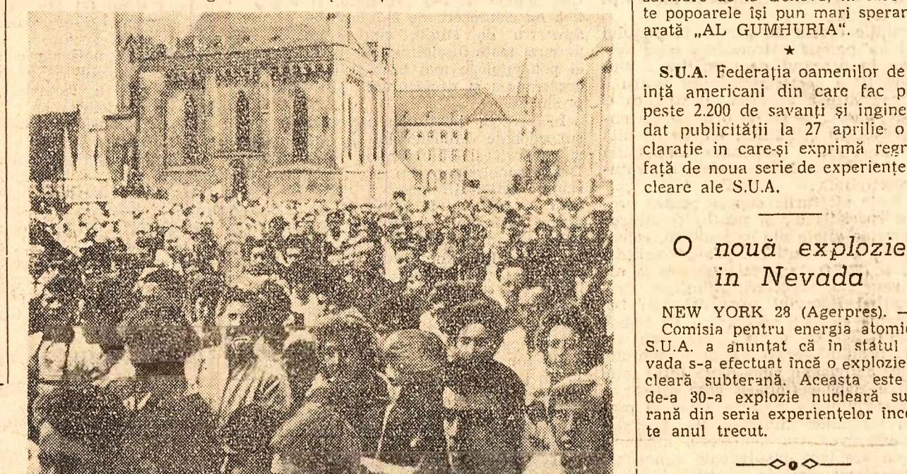
În orașul Bochum (R.F.G.), partizanii ai păcii în timpul unui miting de protest împotriva cursei înarmărilor.

GHANA. Guvernul Ghanei a înmînat însărcinatului cu afaceri interimar al S.U.A. în Ghana o notă în care protestează împotriva reluării experiențelor nucleare în atmosferă de către Statele Unite.