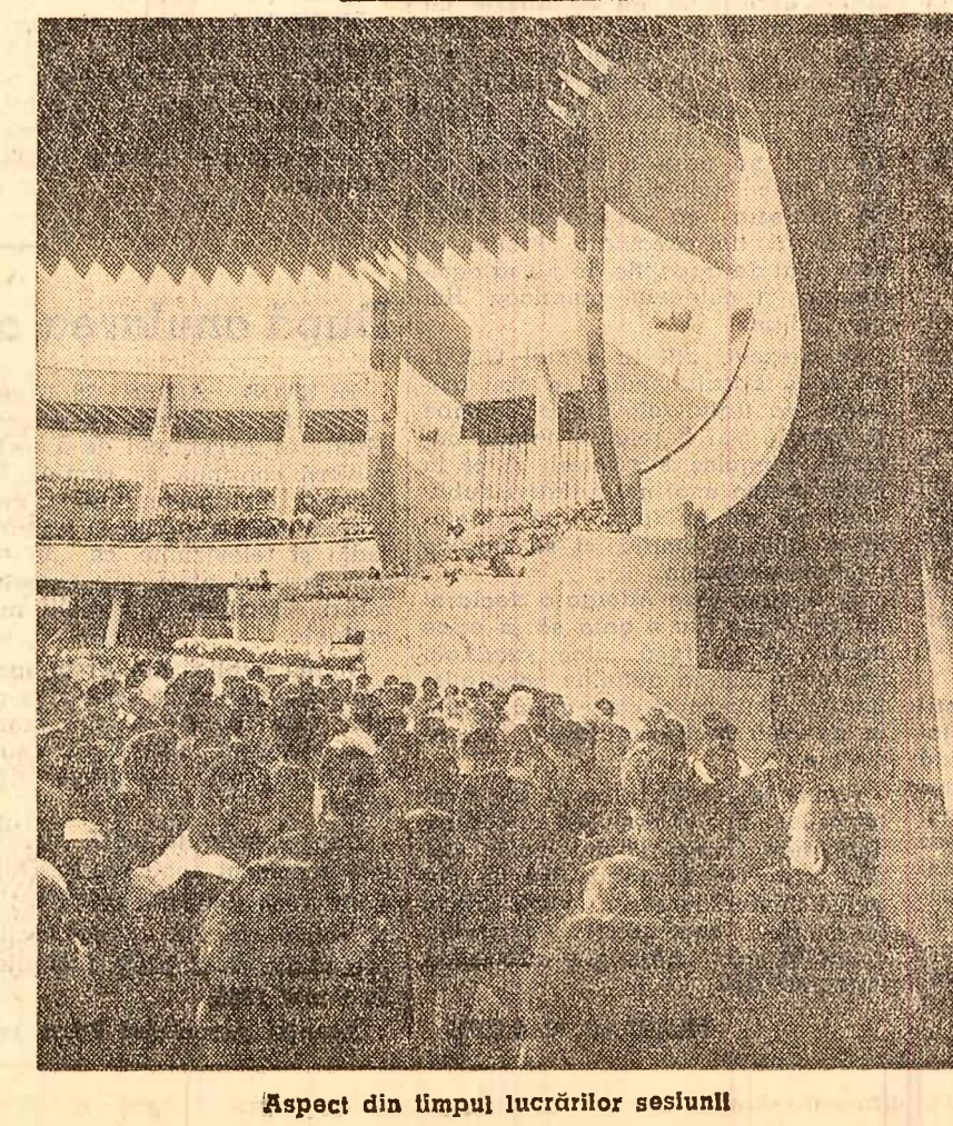
Aspect din timpul lucrărilor sesiunii