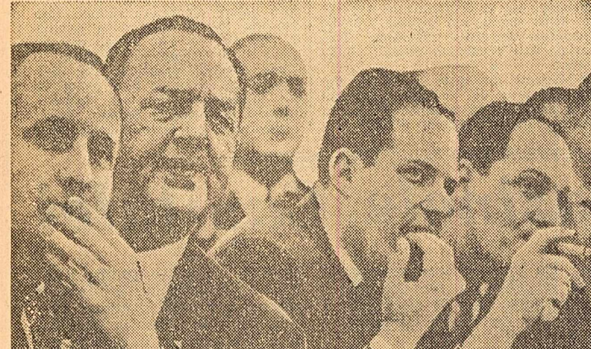
Fotografia, reproducută din revista „PARIS MATCH”, a surprins un grup de agenți de schimb din Wall Street pe a căror față se reflectă panica de la bursa din New York.

NEW YORK. După cum anunță agenția Associated Press, ministrul de război al R.F.G., Strauss, după ce a vizitat bazele de rachete de la Cape Canaveral, a declarat că trupele vest-germane vor primi până în anul 1964 din partea S.U.A. rachete „Pershing” pentru dotarea a trei batalioane. Strauss a adăugat că de factoasele nucleare ale acestor rachete vor dispune americanii.