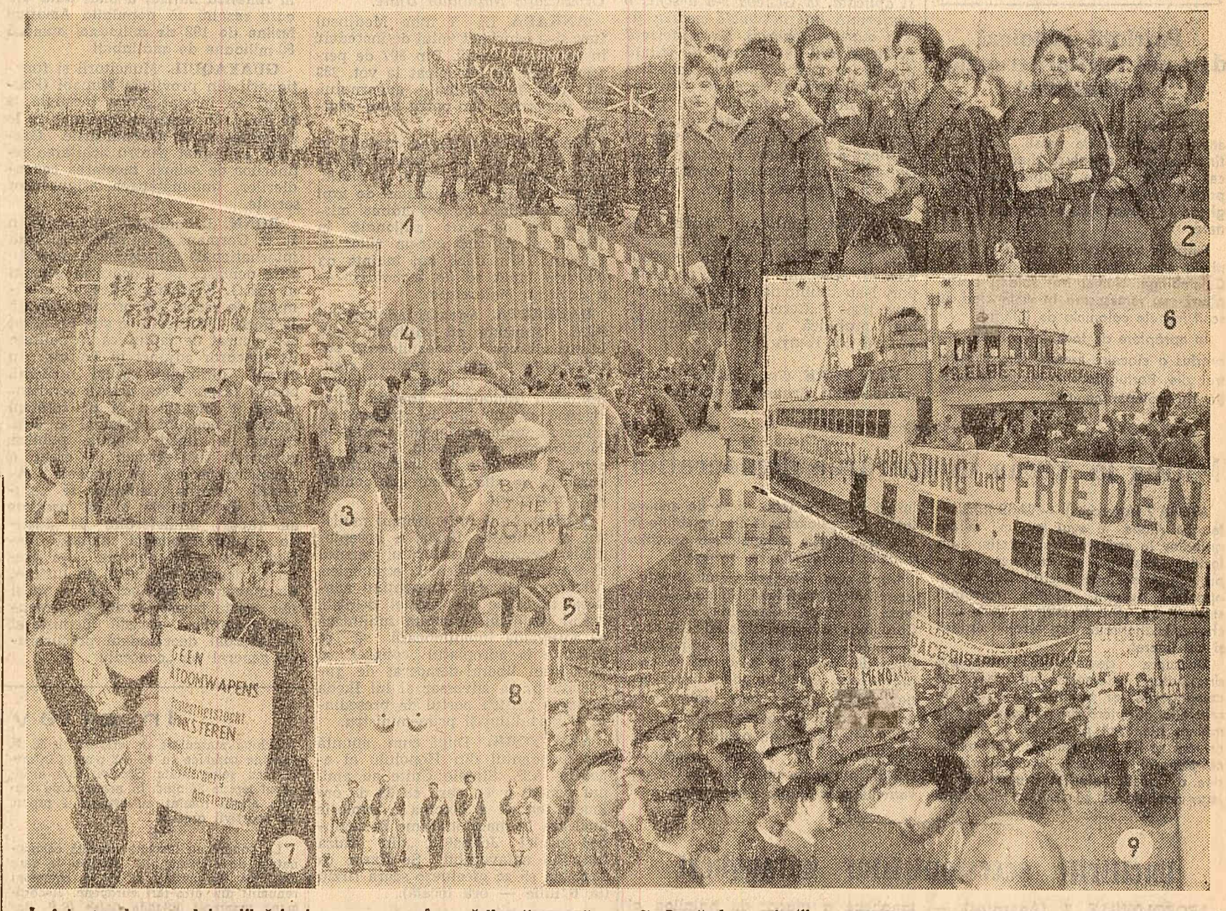
În întreaga lume se intensifică lupta popoarelor pentru înfrîntura dezarmării generale și pace. Iată cîteva imagini ale acestor impunătoare mișcări. Colocanți participanții la marșul Aldermaston - Londra, care a ajuns la o lungime de 13 km (fotografia nr. 1). Reprezentanții ale organizațiilor americane „Femei luptă pentru pace”, sosită la Geneva pentru a rombe conferinței de dezarmare pe lângă interzicerea experiențelor nucleare și încetarea cursei înarmării (fotografia nr. 2). Două demonstrații de protest împotriva experiențelor nucleare americane în Pacific: a) muncitorii din Tokio (fotografia nr. 3) și b) locuitorii orașului Oslo în fața ambasadei S.U.A. (fotografia nr. 4). „Interzicerea bomba!” este lozincă pe care aceștia femeile din Londra a scris-o pe șapelele copilului ei (fotografia nr. 5). Delegații din R.F. Germană la Congresul mondial pentru dezarmare generală și pace, în timpul călătoriei lor spre Mos- cova pe un vas vest-german (fotografia nr. 6). Aspect de la o demonstrație pentru dezarmare din Olanda (fotografia nr. 7). Patru japonezi au pornit într-o lungă călătorie din Hiroșima spre Auschwitz cu chemarea: „Nicolodată, o nouă Hiroșima! Nicolodată un nou Auschwitz!” (fotografia nr. 8). O mare demonstrație în sprijinul dezarmării generale și totale la Milano (fotografia nr. 9).