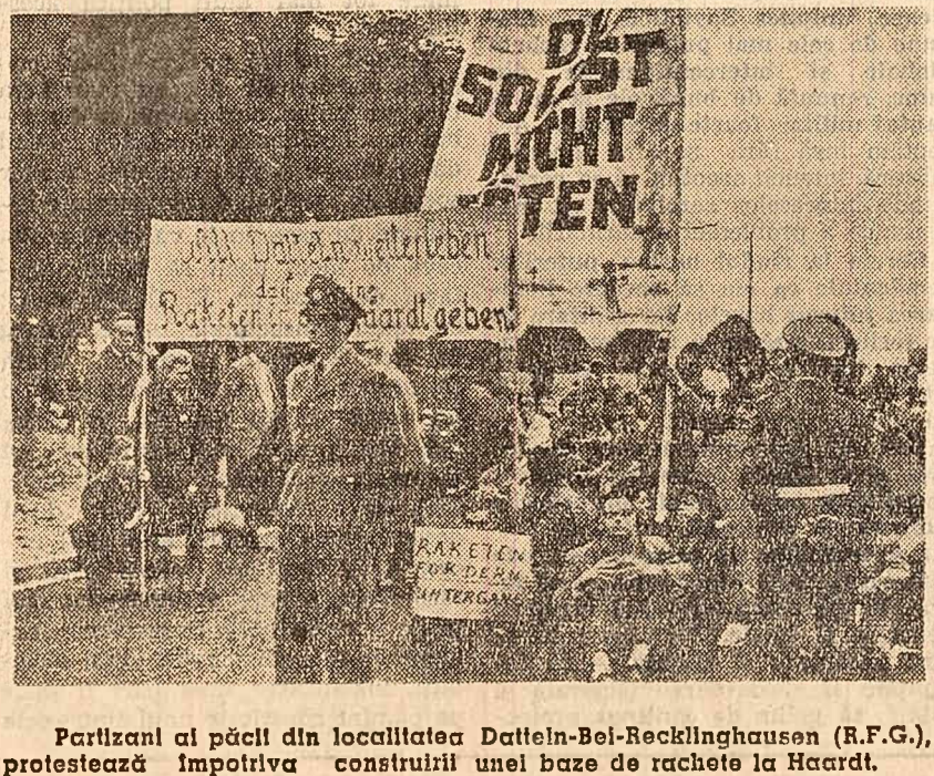
Partizani ai păcii din localitatea Datteln-Bei-Becklinghausen (R.F.G.), protestează împotriva construirii unei baze de rachete la Haard.

CAIRO 10 (Agerpres). — În seara zilei de 9 iulie, ministrul economiei al R.A.U., Abdel Monem El Kaysuni, a deschis într-un cadru festiv Conferința pentru problemele dezvoltării economice la care participă 35 de țări din Asia, Africa, America Latină și Europa. La deschiderea președintele R.A.U., Nasser, a rostit o cuvîntare în care a relevat, printre altele, că la conferință au sosit delegați ai țărilor ale căror popoare depun eforturi serioase pentru reorganizarea vieții lor. În prezent, a spus Nasser, aceste popoare, în ciuda eforturilor pe care le depun, se văd în situația în care decalajul dintre nivelul lor de trai și nivelul de trai al țărilor dezvoltate nu scade ci, dimpotrivă, crește. „În timp ce se depun toate eforturile pentru a salva omenirea de distrugerii ca urmare a exploziilor nucleare — a declarat Nasser — trebuie să se depună, de asemenea, eforturi și mai mari pentru rezolvarea problemei nivelului de trai scăzut”. Delegații au ales ca președinte al conferinței pe șeful delegației R.A.U., ministrul economiei, Kaysuni, și patru vicepreședinți — șefii delegațiilor Braziliei, Ghanai, Indoneziei și Iugoslaviei (cite unul din fiecare dintre cele patru continente).