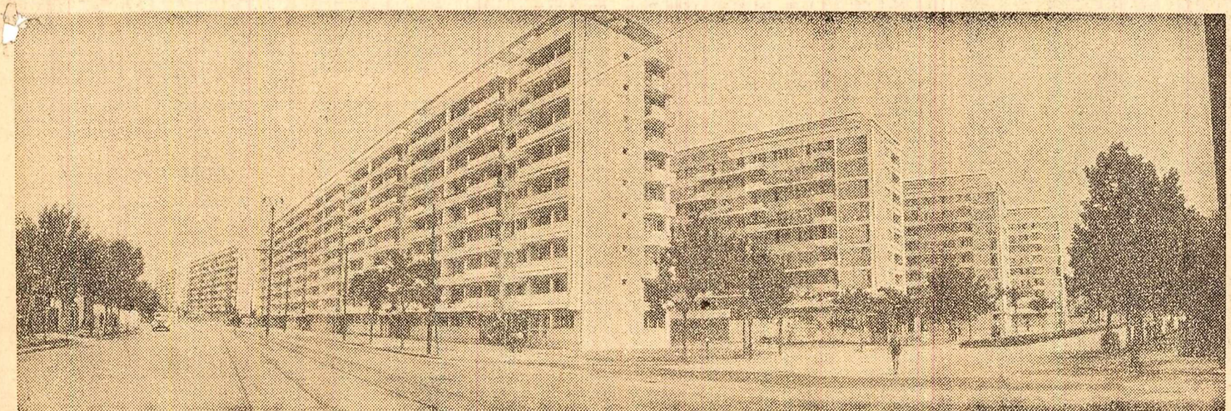
Un nou pelsaj Bucureștean. Pe șoseaua Mihai Bravu.

BAIA MARE (coresp. „Științei”). — La Școala populară de artă din Baia Mare s-a deschis o expoziție de artă plastică. Sînt expuse peste 150 de lucrări de pictură, grafică și sculptură realizate în acest an scolar de elevi.