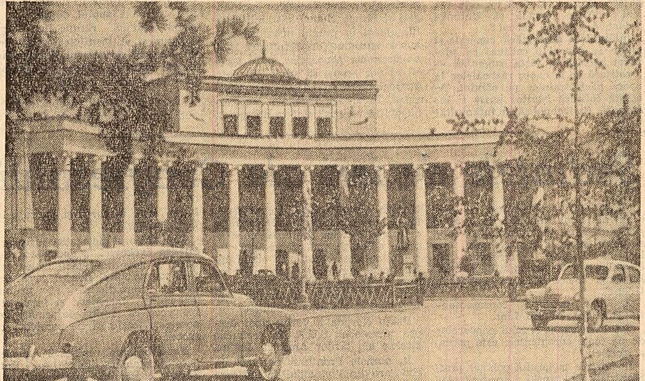
Clădirea Universității naționale mongole din Ulan Bator.