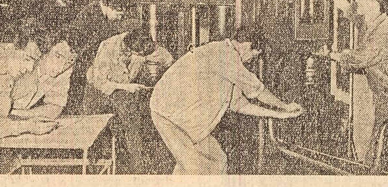
Tinerii studenți la una dintre presele hidraulice de mare putere ale uzinei.