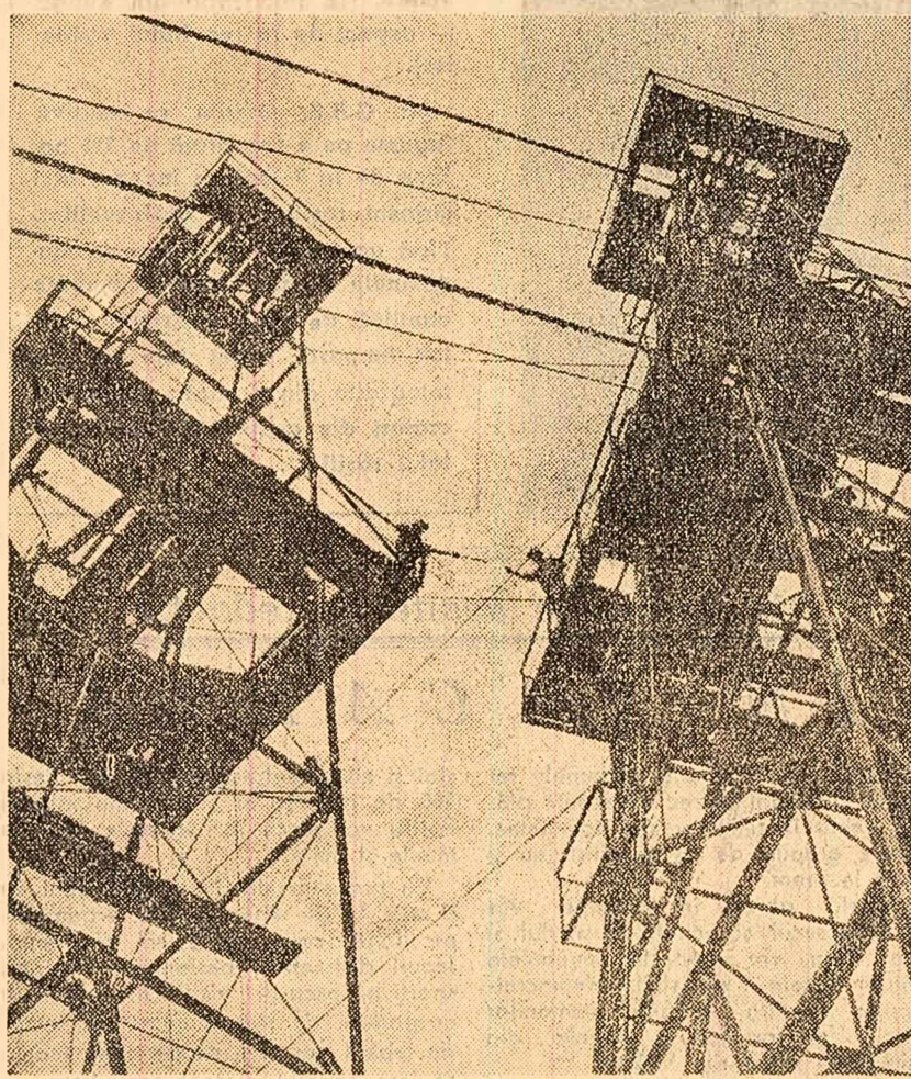
Schelă petrolieră la Băicoi. — Turlele a două sonde cîllate în foră

Comitetele regionale și raionale de partid, sfaturile populare, consiliile agricole au sarcina de mare răspundere în campania de stringere a recoltei. Ele trebuie să îndrumă și de zi activitatea G.A.S., S.M.T., a gospodăriilor colective, sprijinindu-le concret și operativ în rezolvarea tuturor problemelor legate de buna desfășurare a secerării și treieriișului.