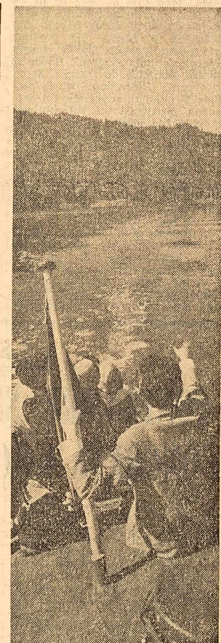
Cu vaporasul pe lac.

COMITETUL CENTRAL AL PARTIDULUI MUNCITORESC ROMIN