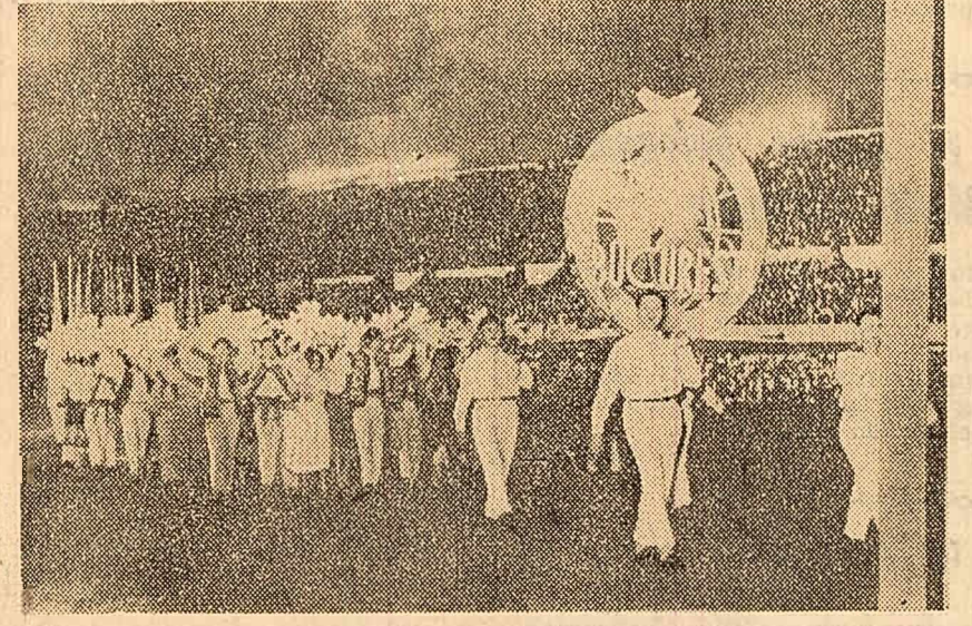
Aspecte de pe marea Stadion Olimpic de la Helsinki: trece delegația tineretului țării noastre (fotografia din stînga); emblema festivalului formată de tineri din cele cinci continente. (fotografia din dreapta).

au continuat concursurile artistice ale festivalului — canto, pian, instrumente de coarde, instrumente de suflat, dansuri populare, orchestre de muzică ușoară și de jazz — care prilejuiesc întreceri între mii de tineri din numeroase țări.