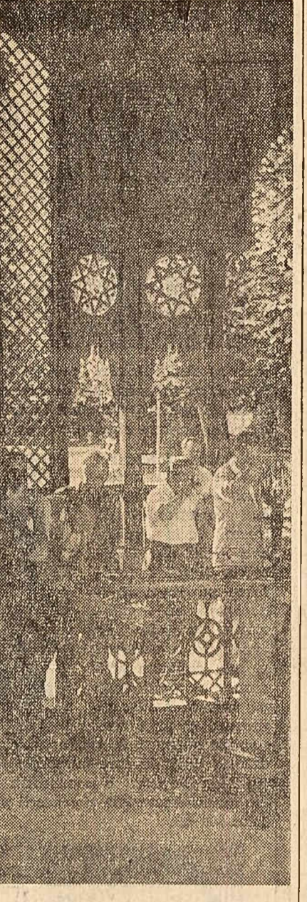
„Băutura cea mai bună / Etoapa de izvor...” spune poeta populară...