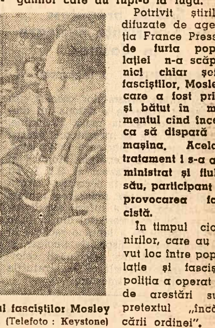
În ciuda intervenției poliției, șeful fascistilor Mosley este trîntit la pămînt.

În timpul ciocnirilor, care au avut loc între populație și fasciști, poliția a operat 54 de arestări sub pretextul „încălțării ordinii”.