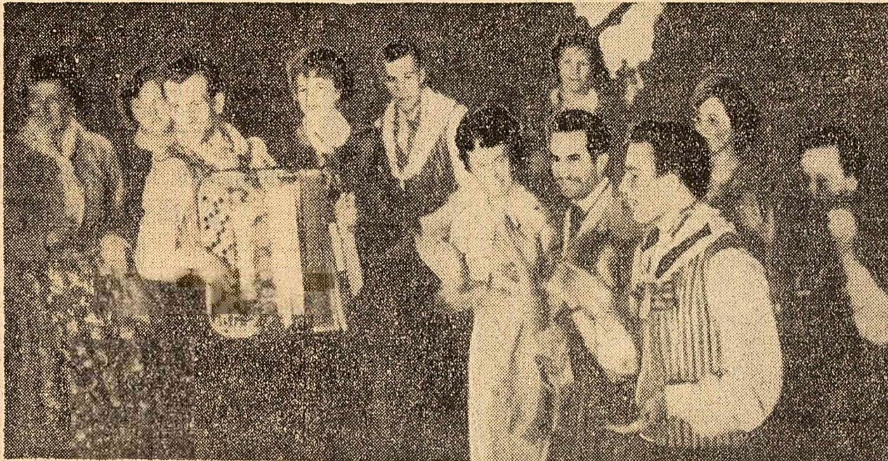
Dansuri și cîntece ale prietenilor pe insula Seurascaari.