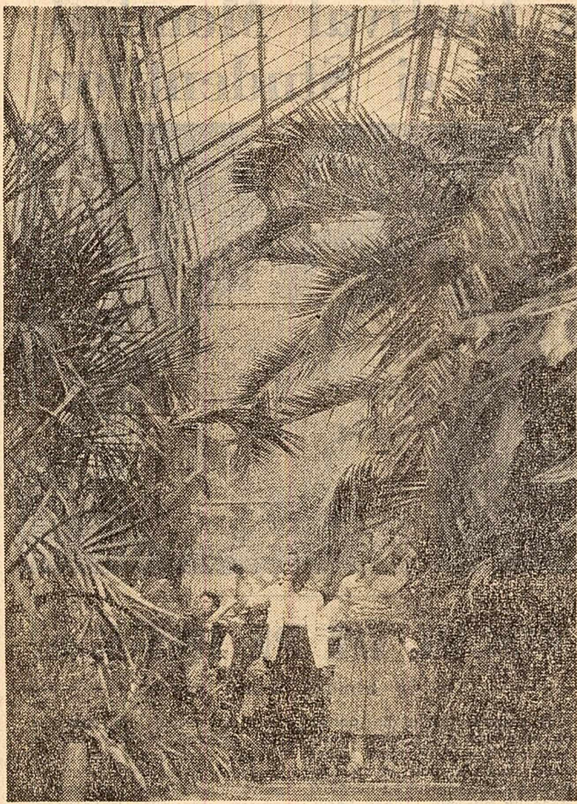
La Grădina Botanică din Cluj