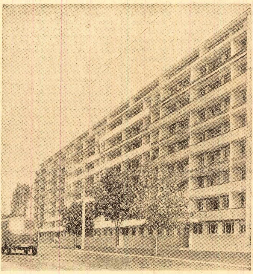
Un nou bloc cu două sute de apartamente din cartierul Giulești dat de curînd în folosință.

Semănatul ne-a găsit pregătit temeinic. Cea mai mare parte din teren era bine lucrat, sămînța din soiuri de înaltă productivitate fusese asigurată din vreme, condiționată și tratată, mașinile erau puse la punct, oamenii bine instruiți.