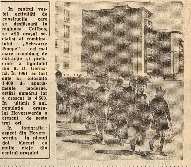
In centrul vaslel activității de construcție care se desfășoară în regiunea Cottbus, se află orașul socialist al combinației „Schwarz Pumpe” — cel mai mare combinat de extracție și prelucrare a lignitului din R. D. Germană. În 1961 au fost date în folosință 1400 de apartamente moderne, astăzi numărul lor a crescut la 4500. În ultimii 5 ani, populația orașului Hoyerswerda a crescut de peste trei ori. In fotografie: aspect din Hoyerswerda. În planul doi, blocuri cu multe etaje din centrul orașului.