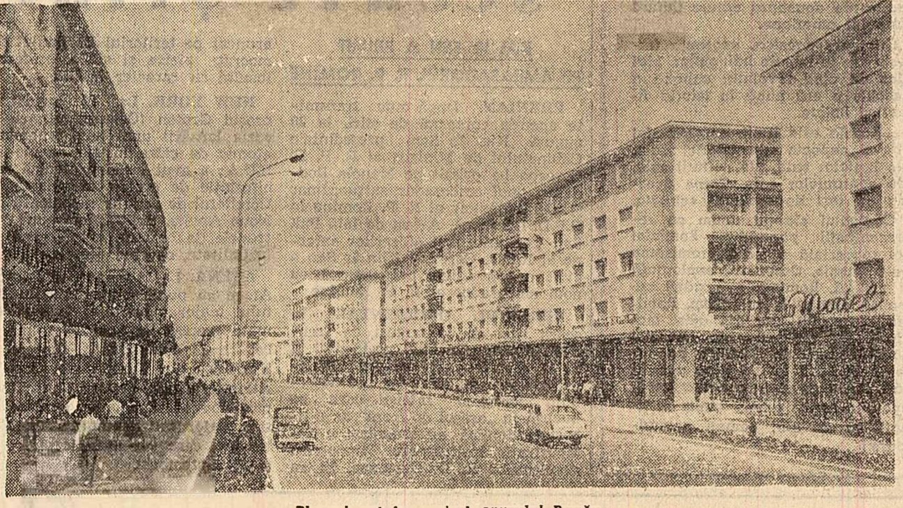
Blocuri noi în centrul orașului Bacău

Directorul Trustului regional de construcții Bacău