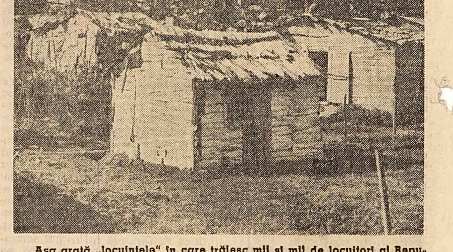
Așa arată „locuințele” în care trăiesc mil și mil de locuitori ai Republicii Dominicană.