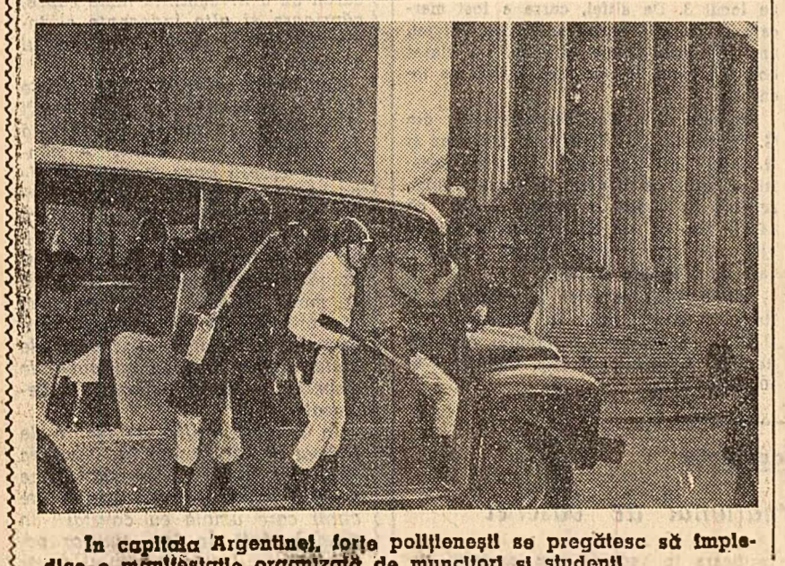
In capitala Argentinei, forțele polițienești se pregătesc să implementeze o măsură de organizare de muncitori și studenți.

Fermierii din Middle West (S.U.A.) au declanșat la 29 august o puternică mișcare revendicativă. Marșul a avut loc la Des Moines (statul Iowa) un mare miting în care au participat peste 20.000 de fermieri.