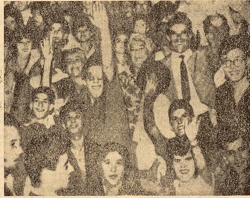
Festivalul național al ziarului „L'Unità”, care a avut loc la Milano, s-a încheiat cu un mare miting. În fotografie: Aspect din timpul mitingului.