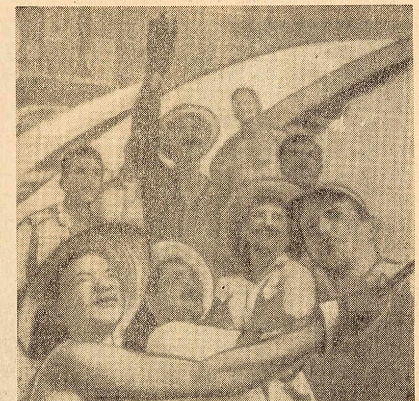
Sprejurnalul opiniei publice mondiale însulește în aceste zile pe patrioții Cubei la noi fapte de eroism în muncă. Locuitorii orașului Santa Clara pun cu mult entuziasm temelile unei noi întreprinderi industriale.