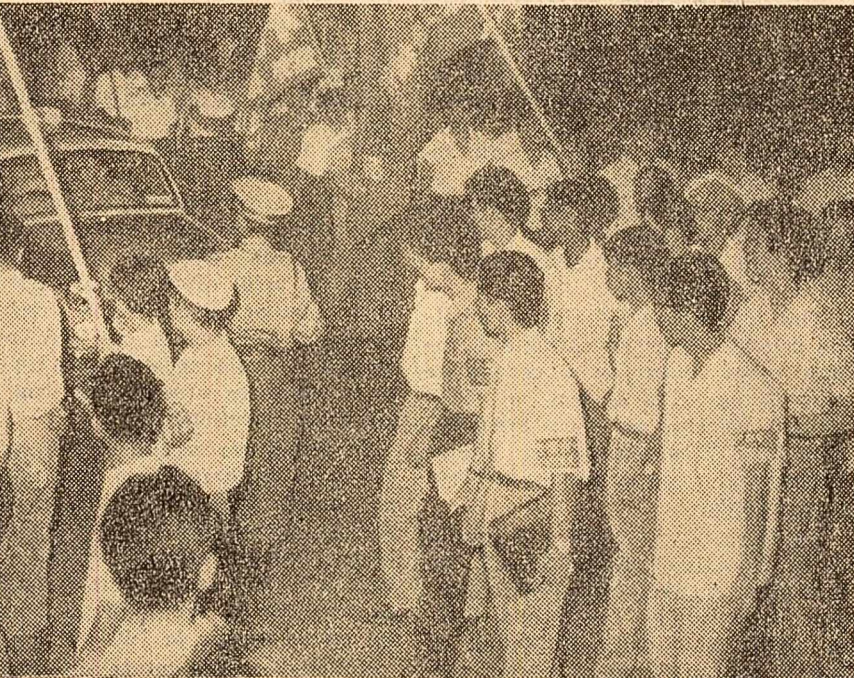
Muncitorii japonezi din prefectura Kanagawa au organizat în orașul Yokohama un miting de protest împotriva amplasării de rachete americane de tip Nike Ajax pe pământurile japoneze. În fotografie: Aspect din timpul mitingului. Pe pancartele participanților este scris: „Nu vom tolera niciodată rachete americane în Japonia”