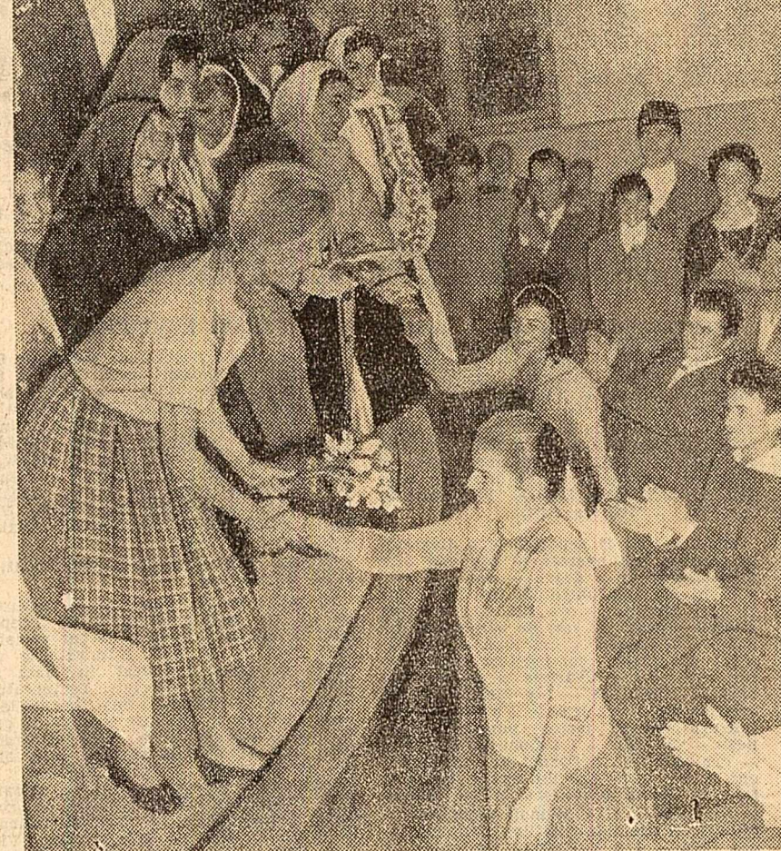
Înfrîntă între eroul din sală și cel de pe scenă.

Stagiunea începută simțită seara în fața colectivităților din comuna Baba Ana, raionul Mîrla, continuă. Ieri seara, același spectacol a fost prezentat în comuna Vadul Săpat, iar în zilele următoare vor avea loc încă opt spectacole în satele raionului. Cu alte cuvinte, premiera continuă în mijlocul eroilor piesei, oamenii satului colectivizat.