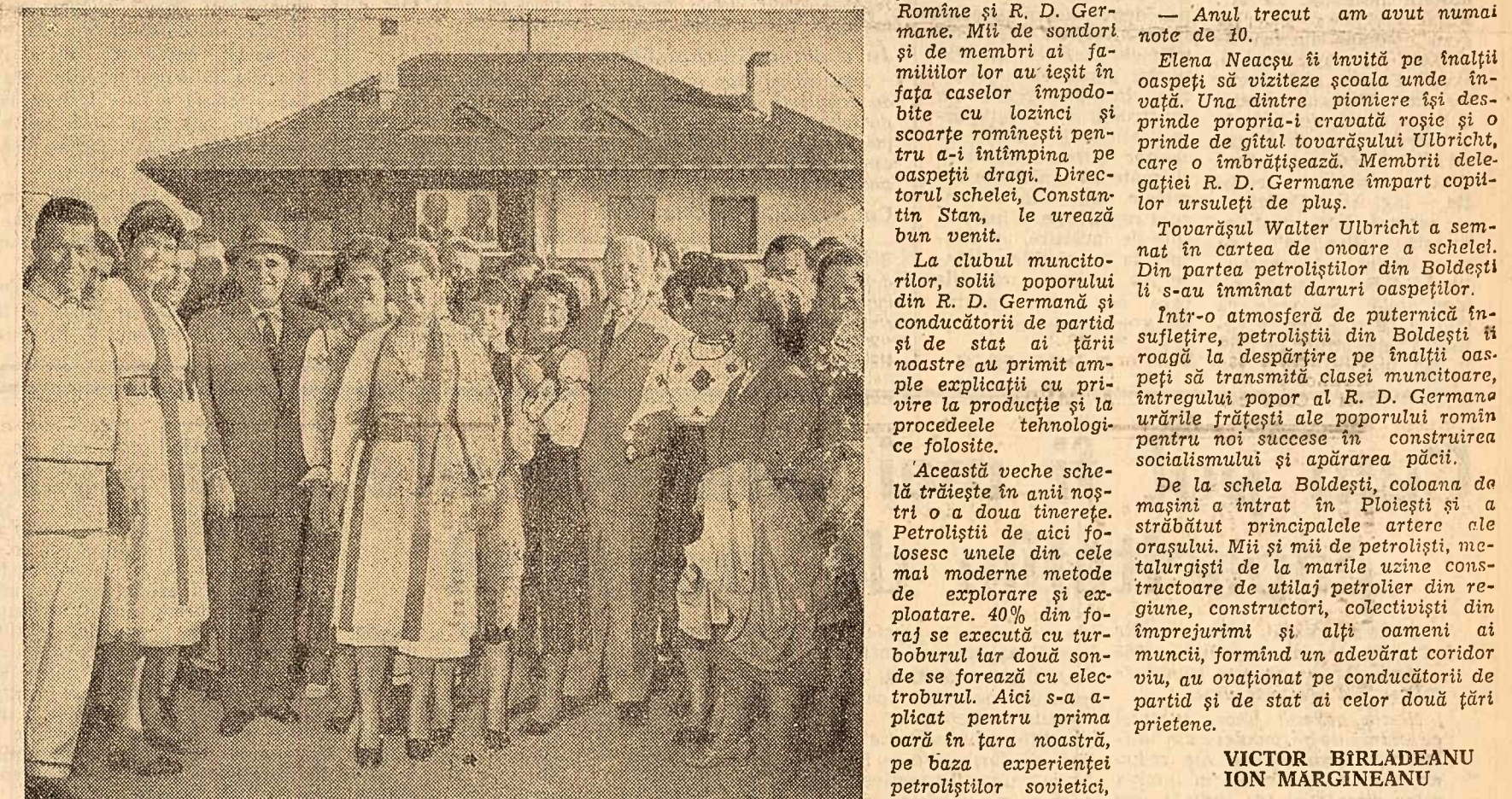
În mijlocul colectivităților din Hărman