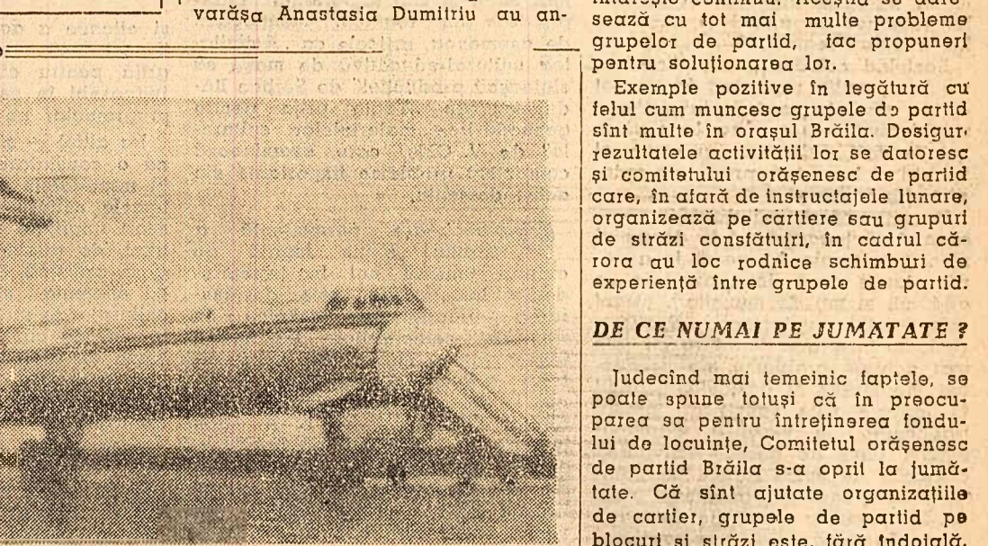
Noul avion de pasageri „IL-62” — o strălucită realizare a tehnicii sovietice. El poate lua la bord 182 persoane și atinge o viteză de 900 km pe oră. Chiar după un zbor egal cu distanța Moscova—New York, în rezervoarele avionului mai rămîne o rezervă de combustibil încă pentru o oră de zbor.

Candidații la concursul de admitere în anul I al Institutului de științe economice „V. I. Lenin” din București parcurg listele rezultatelor la examene. Încă 1 100 de tineri, de acum studenți al acestui institut, vor deveni cadre de mîndre ale economiei noastre socialiste. Săliile de studiu, bibliotecile, căminele sînt gata să-i primească.