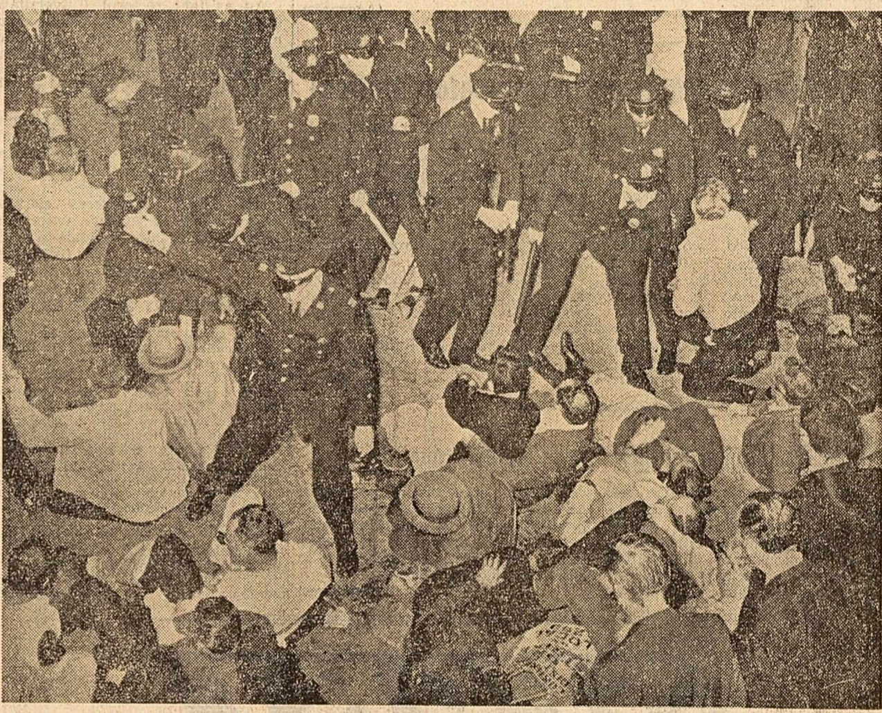
Pește 100 de muncitori greviști ai unei distilării din orașul Philadelphia (S.U.A.) s-au adunat în fața întreprinderii pentru a protesta împotriva exploatării și a tratamentului inuman la care sînt supuși de către patroni. Asupra muncitorilor s-au năpustit o sută de poliști înarmați cu bastoane de cauciuc, Au fost răniți numeroși greviști. În cluda zelului poliștilor, demonstrații s-au regrupat în reptate rînduri manifestînd energie contra samovolicilor acestora. În fotografie: Bastoanele de cauciuc în acțiune.

SANA 2 (Agerpres). — Agenția France Presse anunță că mai multe state arabe, printre care R.A.U., Republica Tunisia și Republica Democrată Populară Algeria au recunoscut Republica Arabă Yemen.