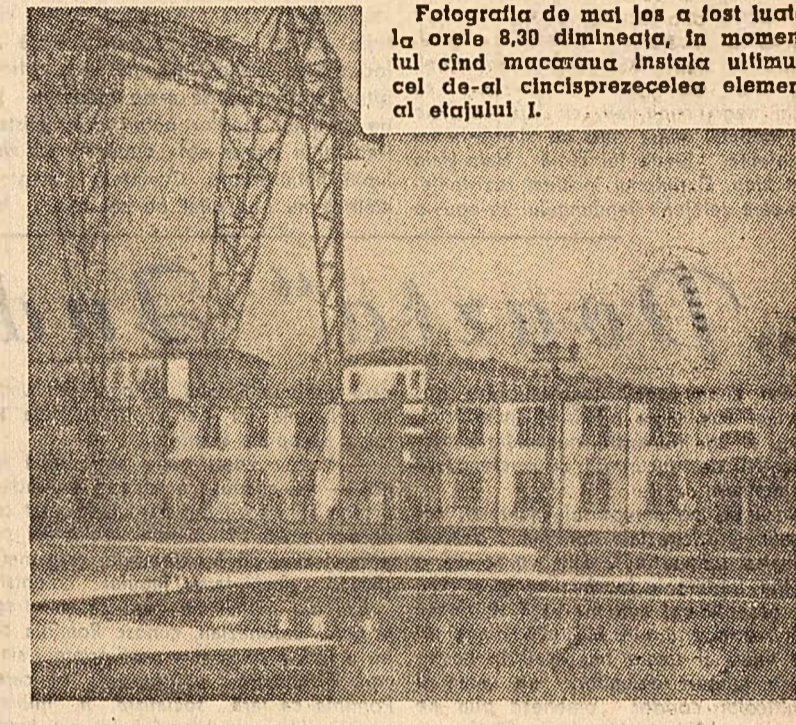
Fotografia de mai jos a fost lucrată la orele 8.30 dimineața, în momentul când macaraza instală ultimul, cel de-al cincisprezecelea element al etajului I.

„ora 7 dimineața. În noul cartier Cereșușki din Moscova, la cartierul nr. 10 un grup de constructori urmărește cu atenție în cordată o interesantă experiență la construirea unui bloc cu cinci etaje.