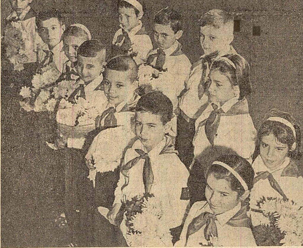
De ieri — o nouă promoție de pionieri la școala medie nr. 7 „I. L. Caragiale” din Capitală.