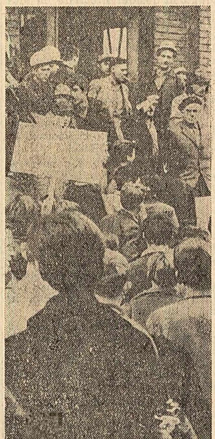
În fața sediului din Merlebach (Franța) al Confederației Generale a Muncii, tineri munceri, care și-au exprimat protestul împotriva cruntelor exploatari la care sînt supuși, ascultă cuvîntările unui activist sindical.