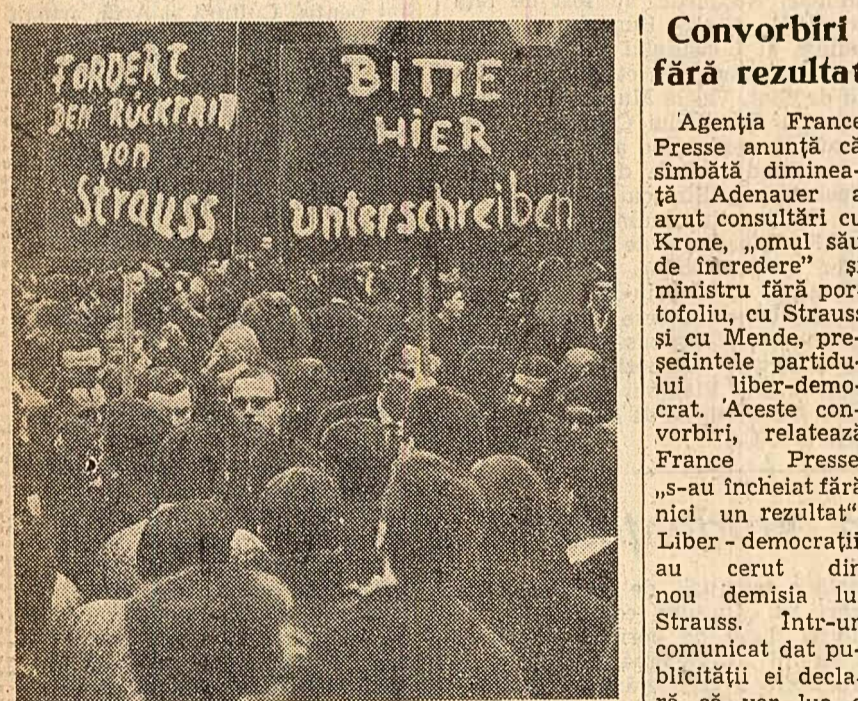
Membru ai Uniunii studenților liberali din München (R.F.G.) string semnături în sprijinul cererii de a fi demis Strauss.