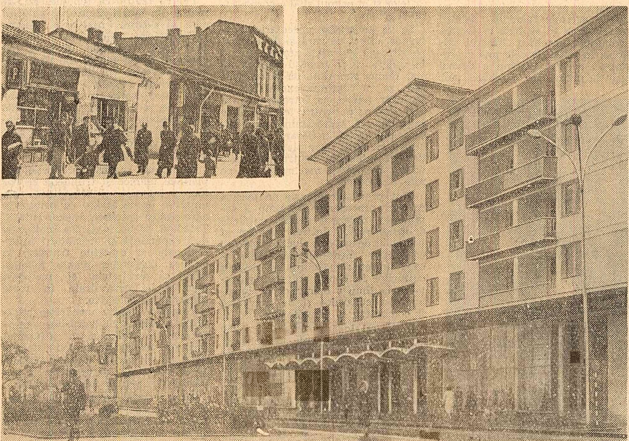
Construcții piteștine au înălțat, în ultimii ani, numeroase blocuri moderne pentru oamenii muncii, la parterul cărora s-au deschis magazine spațioase și străzile Victoriei, în trecut. Azi, strada Victoriei, după cum se poate vedea în fotografie, are o înălțime și deosebită.

Cele mai bune formații artistice selectate de juriu vor participa la selecționul festiv ce va avea loc la 30 Decembrie la Baia Mare.