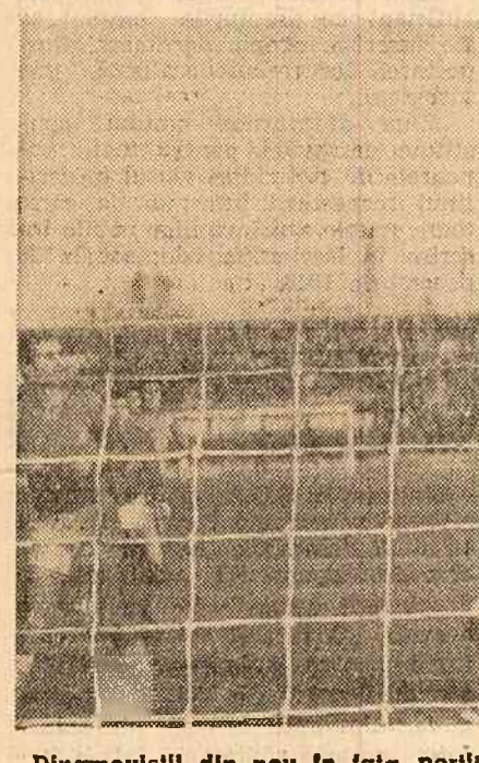
Dinamoviștii din nou în fața porții echipei Steagul Roșu...

au vrut, atacul a constituit punctul forte al echipei în jocul de ieri. O contribuție înspărită la acțiunile ofensive ale echipei sale a avut și Unguroiu. Cu un joc mai puțin, Dinamo București a încheiat prima parte a campionatului pe locul trei în clasamentul general, cu șanse serioase în lupta pentru titlu, care va fi reluată la primăvară. Echipa din Brașov s-a prezentat în jocul de ieri, ca și în celelalte desfășurate în acest sezon, cu o apărare penetrabilă. Portarul Ghiță, deși a primit două goluri parabile, a rezolvat multe situații critice, care ar fi putut majora scorul.