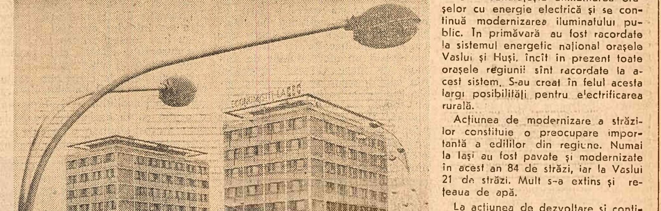
Vedere din Piața Unirii din Iași.

s-au scurs din acest an s-au dat în folosință 1.001 apartamente, alte aproape 1.000 de apartamente urmind să fie preluate locatarilor în aceste săptămîni.