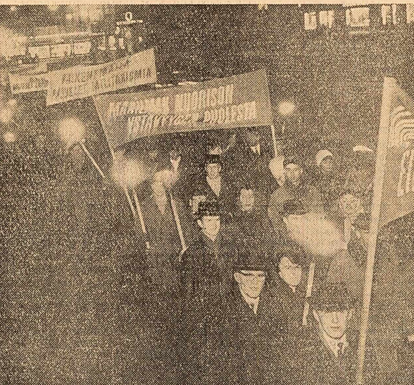
Demonstrație pentru pace și dezarmare la Helsinki (Finlanda).