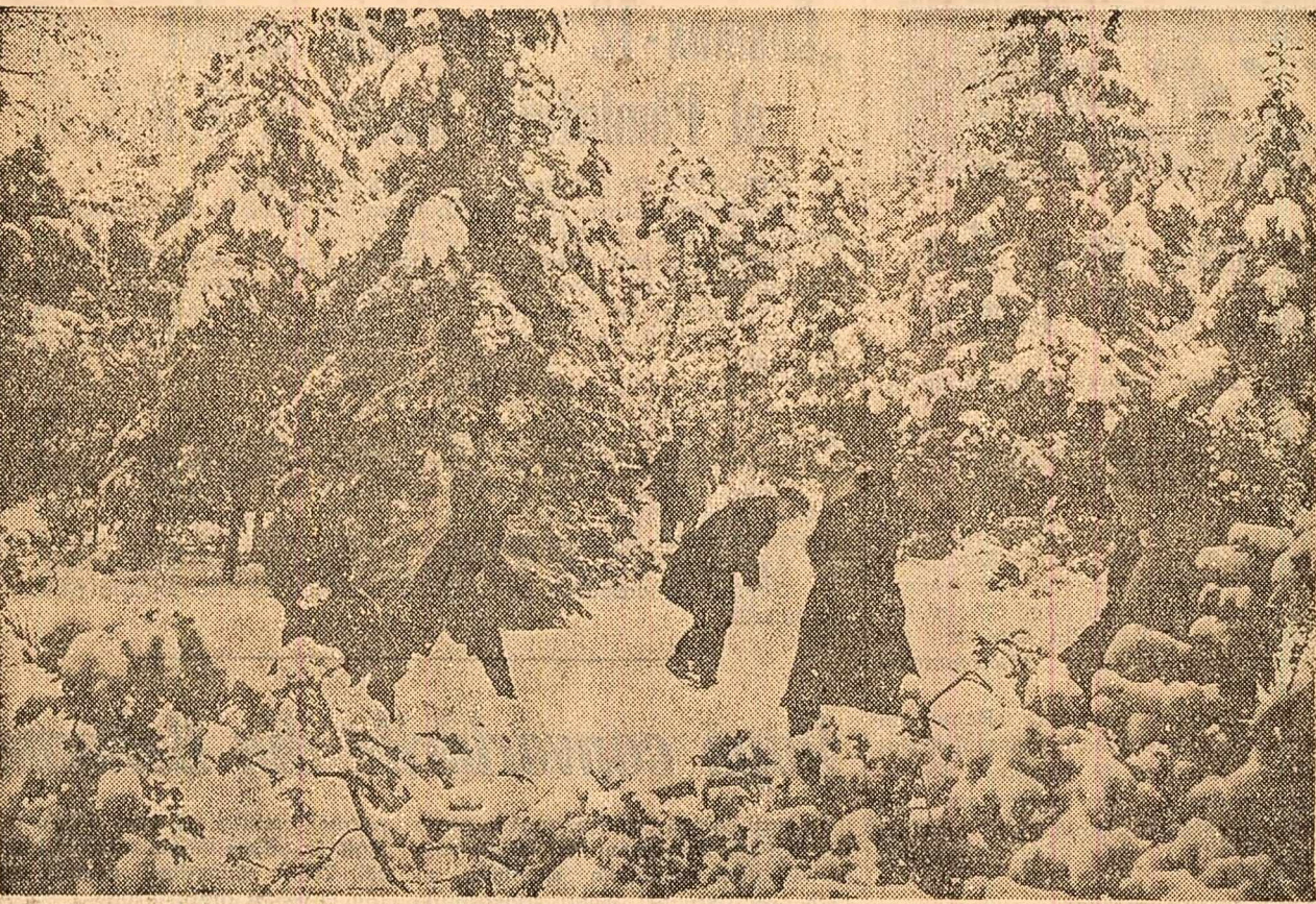
Iarnă frumoasă, zăpadă multă! Anotimpul și-a făcut datoria. Copiii se joacă. Acum e rîndul gospodărilor orașelor să organizeze curățirea străzilor, bunul mers al transportului în comun...