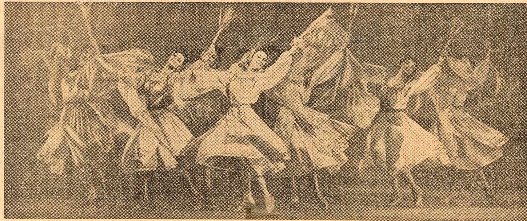
Scenă din spectacolul Ansamblului „Rapsodia Română”