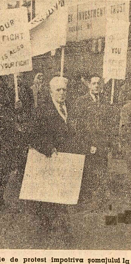
Demonstrație de protest împotriva șomajului la Londra.

organizat în întreaga Italie greve de scurtă durată, mergînd în direcția ore pînă la cîteva zile săptămînal. Acțiunea lor, sprijinită de principalele centrale sindicale italiene, a fost de asemenea însoțită de largi manifestații de simpatie ale muncitorilor din alte ramuri industriale.