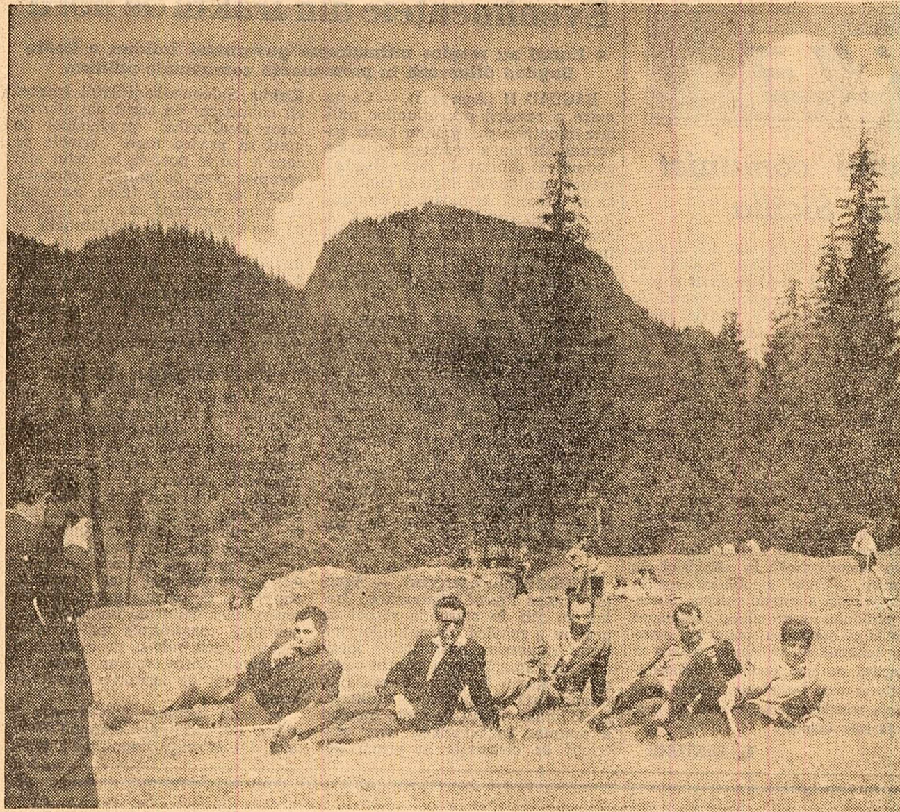
GHEORGHIEI (coresp. „Scintei”). — Zilele acestea au sosit în stațiunea Lacu Roșu, pentru a-și petrece concediul de odihnă, primii oaspeți. Pentru noi sosiți vor fi organizate excursii în jurul lacului, pe muntele Săhărdul Mic, pe virful Ucișăuș, pe Valea Bicășelului, iar cu ajutorul O.N.T.-ului—excursii de cite