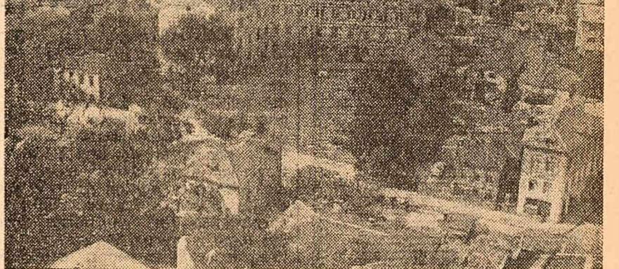
vedere din Plovdiv