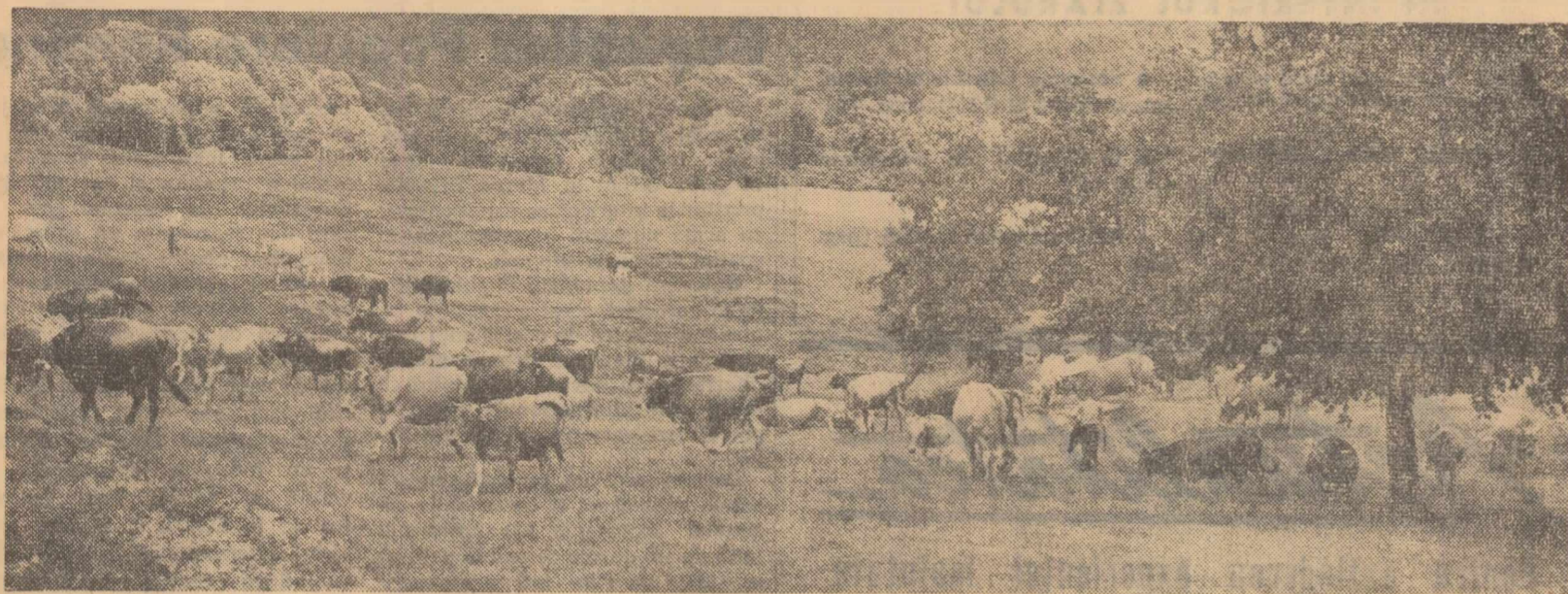
Colectivisti din Domnești, raionul Curtea de Argeș, au aplicat un complex de îmbunătățire (curățire, îngrășare, tarlalizare etc.) pe pășuna alpină de la Bahna Rusului. În urma acestor lucrări se obține o producție de 16-18 tone de iarbă la ha. Pentru adăpostirea animalelor au fost amenajate tabere de vară. În fotografie: o parte din cireada de vaci a gospodăriei la pășune.

In două gospodării colective din raionul Făurei