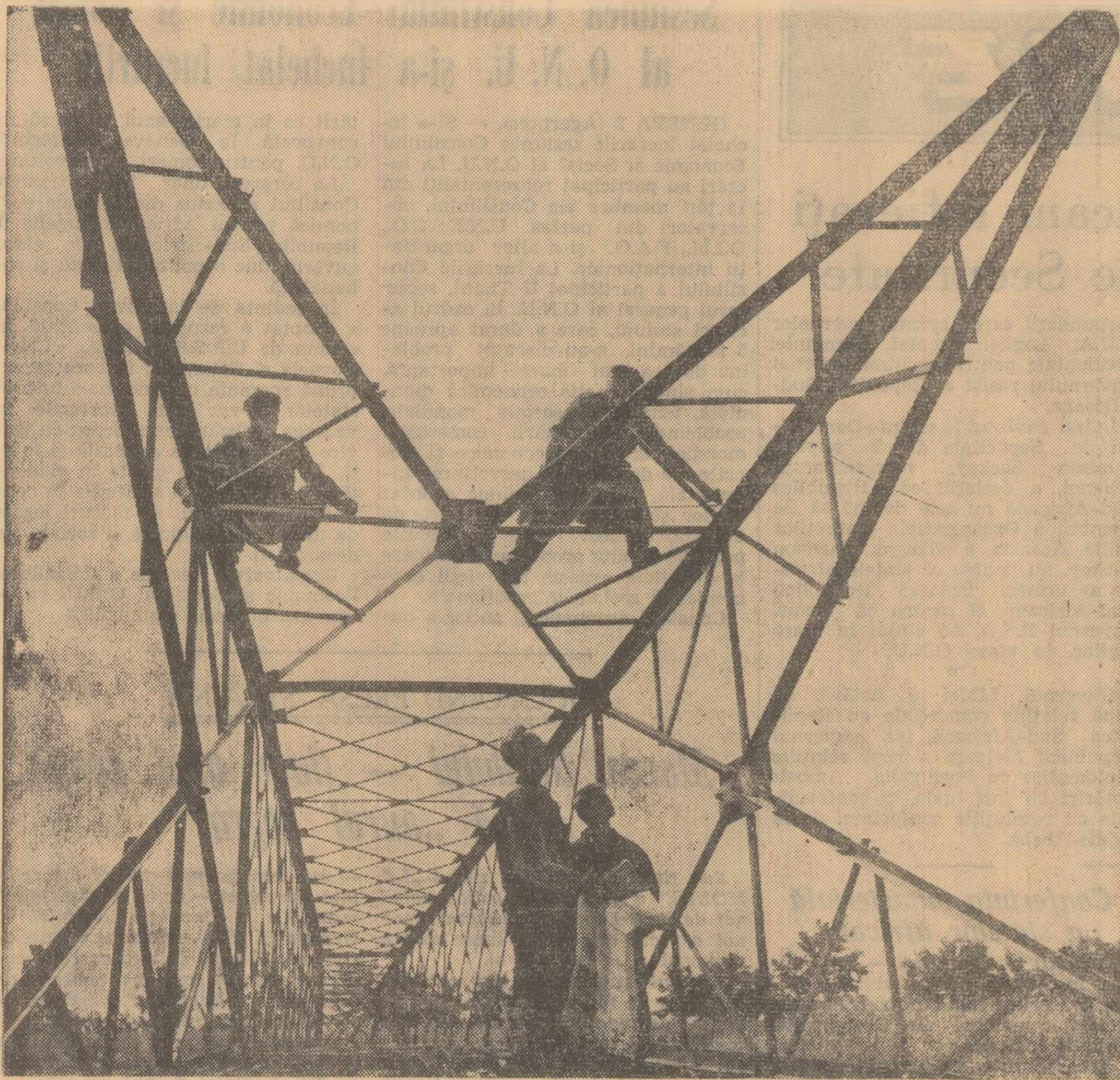
La întreprinderea de construcții și prefabricate, secția Otopeni, se produc stâlpi pentru linii de înaltă tensiune. În fotografie: o echipă lucrează la asamblarea unui stâlp de 110 kv.