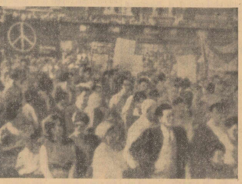
Cu prilejul unei demonstrații în Trafalgar Square partizanii păcii din Londra au salutată încheierea Tratatului tripartit.

CONAKRY 2 (Agerpres). — Forțele patriotice ale mișcării de eliberare din Guinea Portugheză luptă cu succes împotriva forțelor colonialiste portugheze. Într-un comunicat al Partidului african al independenței naționale din Guinea Portugheză și insulele Capului Verde se arată că în cursul recentelor operațiuni militare desfășurate în nordul Guineei Portugheze au fost ucisii 107 soldați portughezi. În comunicat se arată că în cursul primelor 15 zile ale lunii iulie forțele patriotice au organizat 6 ambuscade și au întreprins numeroase atacuri împotriva trupelor colonialiste portugheze din regiunile Mansoa, Bissora, Mansaba, la nord de capitala Bissau și în alte regiuni. În comunicat se subliniază că în prezent se duc lupte împotriva trupelor colonialiste portugheze în regiunea Pirada și în regiunile din nord-estul țării. În numeroase regiuni din Guinea Portugheză se semnalează acte de sabotaj îndreptate împotriva trupelor portugheze.