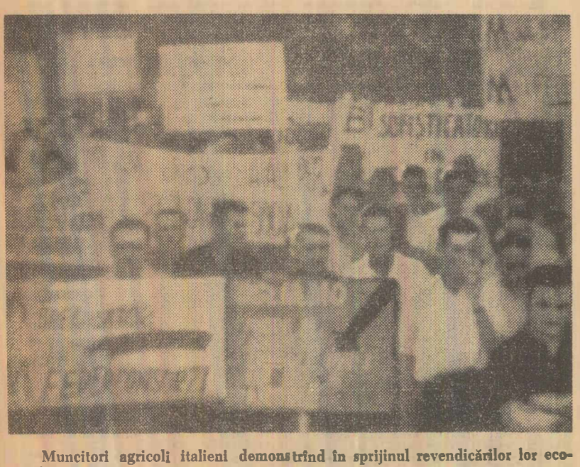
Muncitori agricoli italieni demonstrînd în sprijinul revendicărilor lor economice.

între țările N.A.T.O. și statele participante la Tratatul de la Varșovia, Kennedy a arătat, după cum relatează corespondentul agenției U. P. I., că „Statele Unite intenționează să continue negocierile pentru încheierea unui pact de neagresiune, indiferent de atitudinea președintelui francez de Gaulle.” El a spus de asemenea că va continua consultarea aliaților în această problemă. Întrebat dacă Statele Unite intenționează să împărtășească Franței unele secrete din domeniul armii nucleare pentru ca Franța să înceteze și ea experiențele, președintele Kennedy a evitat să dea un răspuns direct la această problemă. Trecînd la probleme de ordin intern, Kennedy și-a exprimat îngrijorarea în legătură cu faptul că circa 400 000 de tineri americani nu se vor mai reintoarce în școli în septembrie anul curent, din cauza lipsei mijloacelor materiale. De asemenea, alți 700 000 de studenți, din a călești motive, nu vor putea să termine anul școlar 1963-1964. El a calificat ca fiind „o problemă națională foarte serioasă” faptul că circa un milion de tineri americani sînt nevoiți să-și întrerupă studiile.