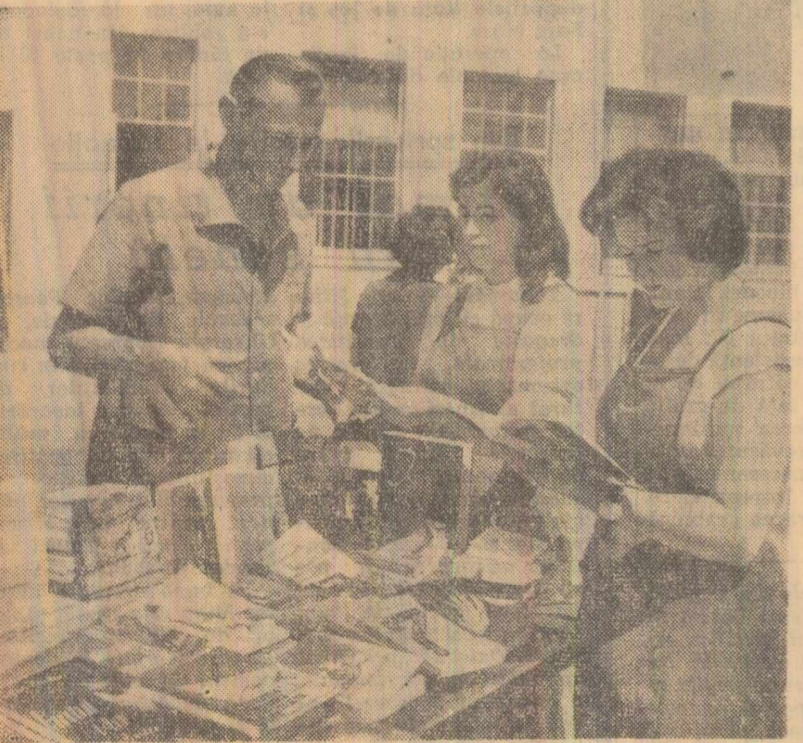
Peste 300 de muncitori de la întreprinderea „Tehnica textilă” din Capitală își cumpără cu regularitate cărți de la standul „Cartea la locul de muncă”.

Ca și în alte gospodării colective frunțile în creșterea animalelor, colectivitățile din comuna Surdila Găiseanca s-au ocupat cu grijă de asigurarea bazei furajelor, aceasta fiind o condiție hotărîtoare pentru mărirea efectivelor de animale și obținerea de producții sporite de la ele. În fiecare an, la întocmirea planului de producție s-a rezervat o suprafață de teren corespunzătoare pentru cultivarea plantelor furajere și s-au luat măsuri pentru obținerea de producții sporite la hectar.