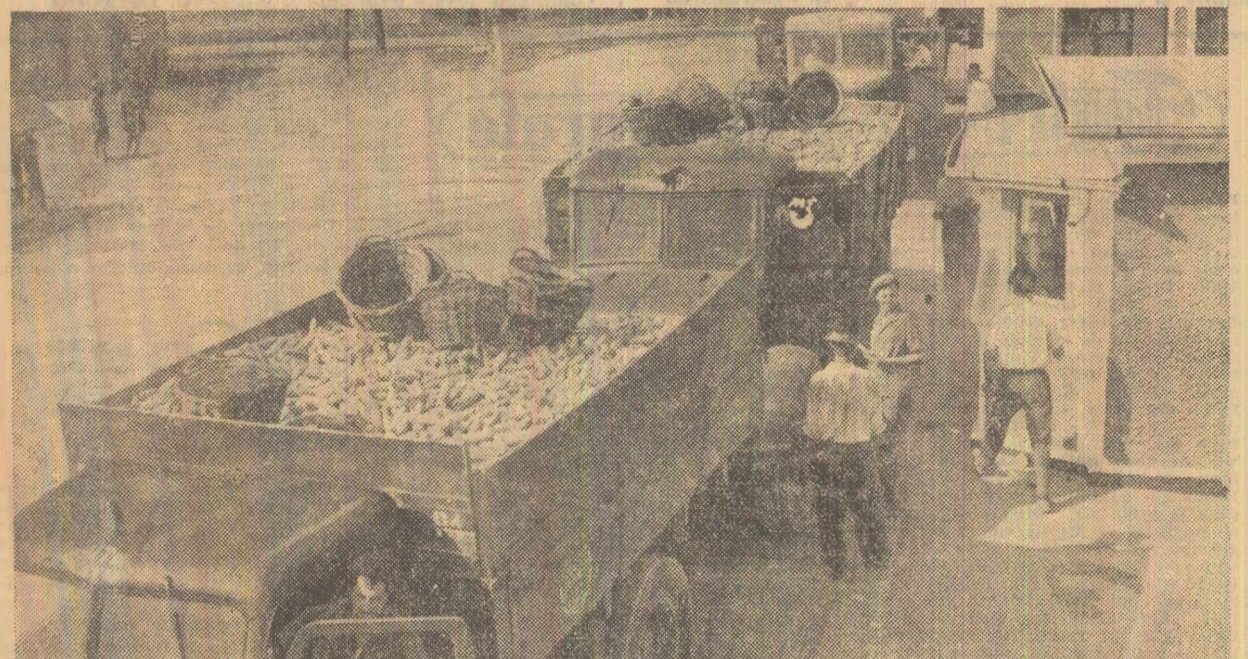
La baza de recepție din Inoștești, regiunea Ploiești, a sosit un nou transport de porumb de la G.A.S. Albești