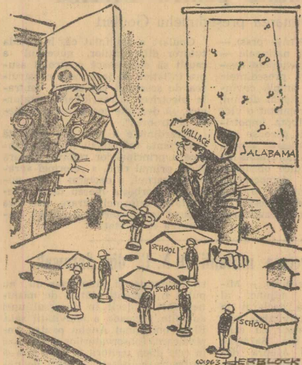
„Știri proaste, șefule, se adresează alarmat șeful gării civile din Alabama, guvernatorului Wallace. Educația a izbucnit în altă zonă”. Astfel, infamizărea caricaturistului american Herlock situația de pe „frontul învățămîntului din Alabama”, în „New York Herald Tribune”.

După cum transmite France Presse, guvernul francez a discutat un plan de măsuri economice, menit să stăvilească actualele tendințe inflaționiste și să asigure o stabilizare a economiei țării. Ministrul informațiilor Alain Peyrefitte a recunoscut într-o declarație, că țara „se află în fața spectrului inflației” și că, din punct de vedere economic, „trece printr-o criză”. Agenția UPI menționează că acest plan de măsuri prevede, printre altele, înghețarea salariilor în întreprinderile de stat și în instituțiile guvernamentale, reducerea alocațiilor familiale și restricții la cumpărările de mărfuri pe credit.