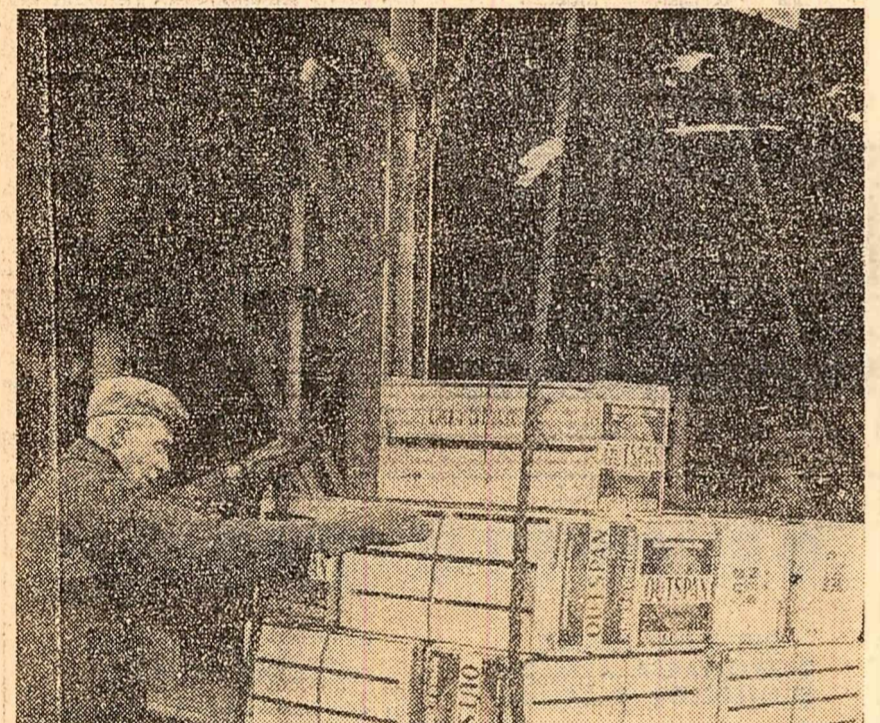
In semn de protest împotriva discriminării rasiale practicate în Republica Sud-Africană, mărfurile importate din această țară în Suedia nu găsesc cumpărători. În fotografie: se reincarcă 144 tone de portocale provenite din R.S.A. pentru a fi transportate în altă țară

In conformitate cu acordul dintre C.A.E.R. și guvernul Iugoslaviei cu privire la participarea R.S.F. Iugoslaviei la lucrările organelor C.A.E.R., la ședința Comisiei au participat reprezentanți din partea R. P. Chineze, R.P.D. Coreene, Cubei și R. D. Vietnam.