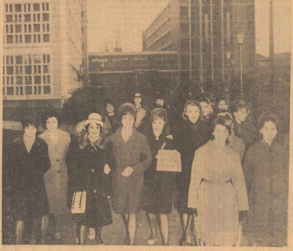
Noi, studentele, spre secția de votare