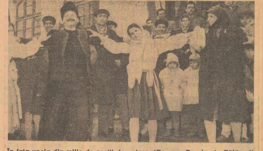
În fața uneia din mîile de secții de votare. (Comuna Dorobanțu-Călărași)