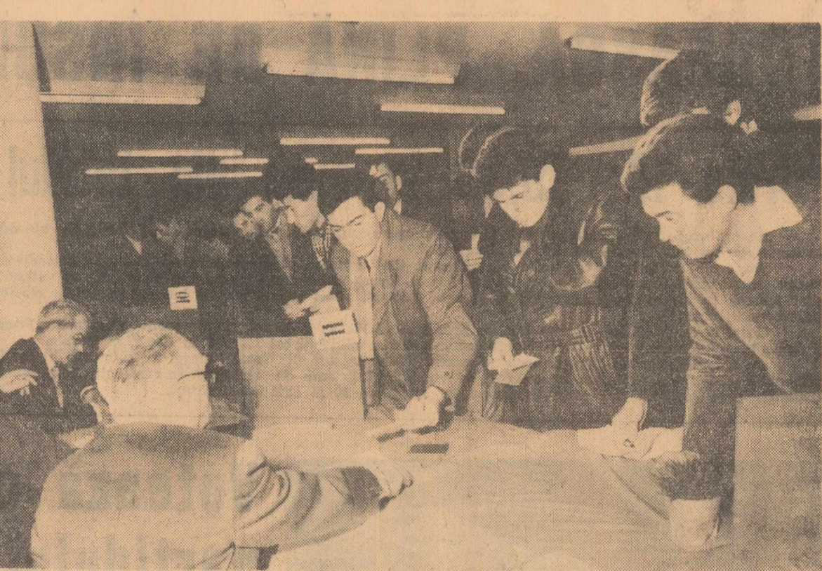
Cu mîile, la primul vot

A adresat această invitație în-lîngindu-și o oarecare timiditate, pe cînd în același raion, la secția 16, altă debutantă la urne se apropie de președintele comisiei și îi spune: