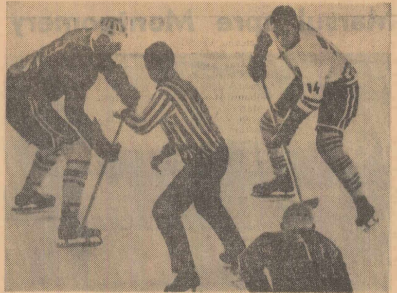
La Tampere (Finlanda) s-au desfășurat ieri două meciuri în cadrul campionatului mondial de hochei pe gheață. În grupa B, R. D. Germană a învins-o cu 7—4 reprezentativa S.U.A., iar în grupa A, R. F. Germană a învins-o cu 2—1 de echipa Austriei. Fotografia de mai sus redă o fază din partida Cehoslovacia-R. D. Germană, disputată zilele trecute