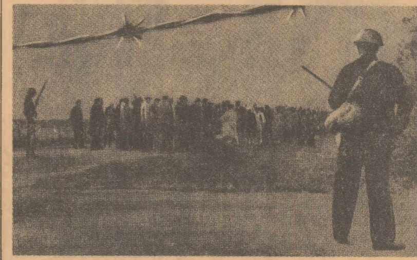
Unități de poliție interzic intrarea în Comden (statul Alabama) a unui grup de cetățeni de culoare, care demonstrează pentru dreptul de vot

SELMA. — Trupe ale statului Alabama, cu un efectiv de 500 de oameni, și-au făcut marșul intrarea în orașul Selma, sosind din capitala statului, Montgomery. Purținând caști și arme, ei au luat imediat poziție spre a bara drumul cortegiului de negri și albi care au hotărît să pornească „marșul spre Montgomery” în favoarea integrării rasiale. Trismisul special al agenției A.F.P. transmise că este așteptată o „încercare de forță” între pastorul Martin Luther King, laureat al premiului Nobel pentru pace, lider al populației de culoare, și guvernatorul statului, George Wallace, cunoscut pentru pozițiile sale rasiste. El a declarat că va împiedica marșul. „După sălbatice represive de duminică a primului marș spre Montgomery, care a provocat indignarea aproape unanimă a presei a-