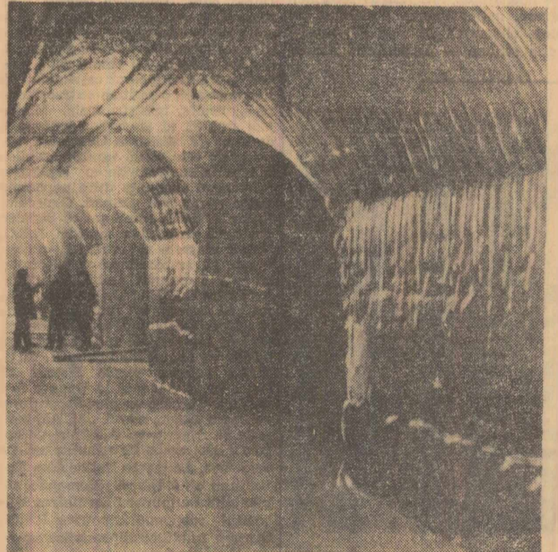
Depozit de alimente săpat în gheață

Timpul probabil pentru următoarele 3 zile: Vreme schimbătoare, cu cer variabil, temporar acoperit. Vor cădea precipitații izolate sub formă de ploaie, izbitoare și ninsoare, mai frecvente în jumătatea de sud a țării. Vînt slab, pînă la puternic, din sectorul nord-est. Temperatura în creștere, mai ales în sud-vestul țării. Minimele vor fi cuprinse între minus și plus grade, iar maximele între minus și plus grade, local mai ridicate la sfîrșitul intervalului. Izolat ceață. În București: Vreme schimbătoare, cu cer variabil, temporar noros. Vor cădea precipitații temporare. Vînt potrivit din nord-est. Temperatura în creștere. Dimineața și seara ceață.