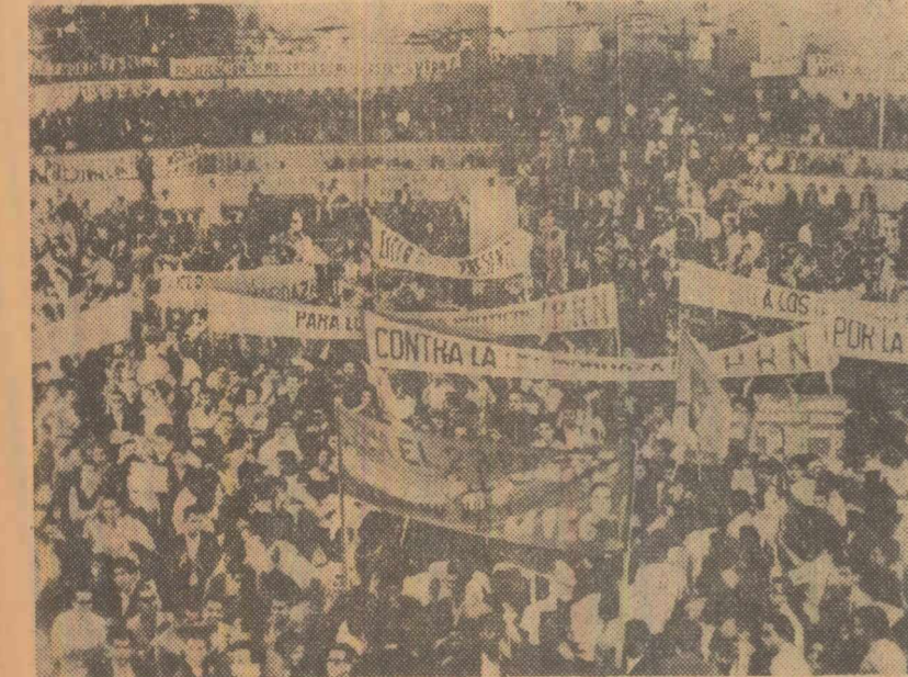
La Caracas (Venezuela) a avut loc un miting de masă la care participanții au cerut eliberarea deținuților politici și sporirea salariilor

„Sintem interesați în întărirea păcii în întreaga lume”, a declarat Eduardo Frei, președintele Republicii Chile, la o conferință de presă organizată după anunțarea rezultatelor alegerilor din 7 martie. Expunând principiile politicii interne și externe ale guvernului său, Frei a declarat: „Guvernul chilian este adeptul stabilirii de relații diplomatice și economice cu toate țările și consideră că divergențele ideologice nu trebuie să împiedice dezvoltarea unor asemenea relații”.