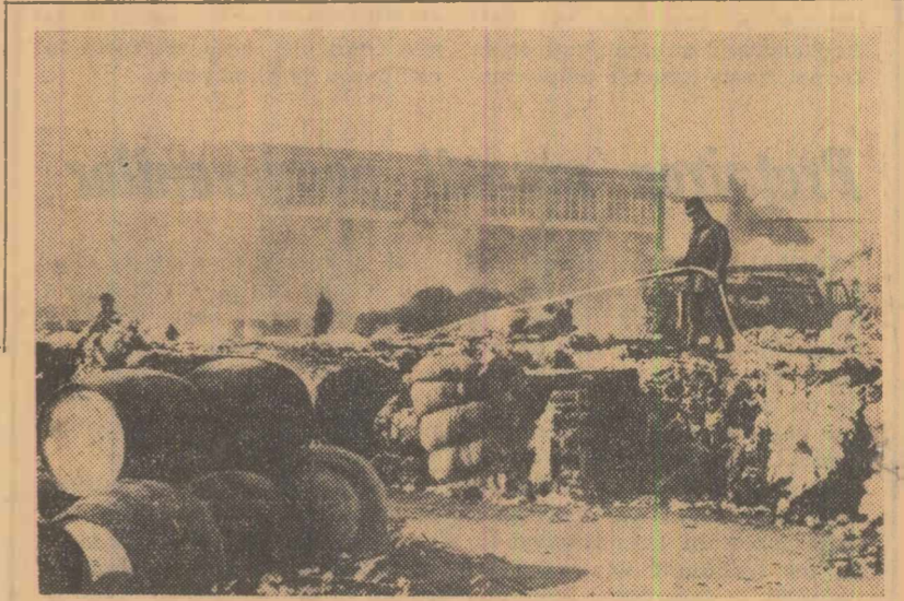
Zilele trecute în docurile portului Barcelona a izbucnit un incendiu care a distrus peste 1 500 baloturi de bumbac depozitate aici

de a se abține de la acțiuni care ar putea agrava situația din Congo. Consiliul a dezbătut, de asemenea, problema apartheidului din Africa de sud și întăririi boicotului față de această țară, situația din Rhodesia de sud, lupta de eliberare a țărilor din Africa și alte probleme. În luna septembrie va avea loc la Accra conferința șefilor de state și guverne ale țărilor membre ale O.U.A.