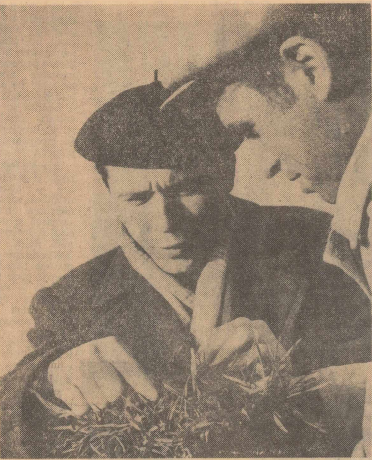
La cooperativa agricolă Radovanu, raionul Oltenița. Se examinează starea de vegetație a grâului.

Organele și organizațiile de partid, consiliile agricole sînt chemate să se ocupe îndeaproape de executarea la timp a lucrărilor agricole, condiție hotărîtoare pentru obținerea unor recolte bogate în 1963.