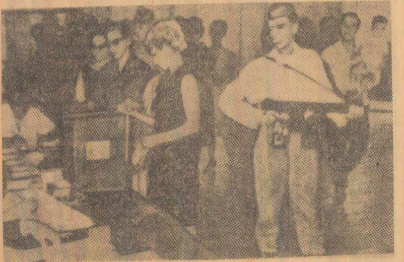
În timpul recentelor alegeri din Argentina, pentru a se preveni eventuale incidente, în localitățile de vot au fost instalate scuturile înarmate

HANOI 18 (Agerpres). — Cu prilejul „Zilei de luptă a Vietnamului împotriva imperialismului american”, care se sărbătorește la 19 martie, Frontul Patriei din Vietnam a publicat un apel în care condamnă războiul dus împotriva poporului sud-vietnamez, precum și atacurile întreprinse în ultimul timp asupra teritoriului R. D. Vietnam. „Aceste acțiuni ale imperialismului american, se spune în apel, au creat o situație încordată și amenință în mod grav securitatea tuturor națiunilor din Indochina și Asia de sud-est”. În apel se subliniază necesitatea aplicării întocmai a acordurilor de la Geneva, a încetării războiului din Vietnamul de sud și a provocării armatei împotriva R. D. Vietnam, a retragerii trupelor străine și armelor din Vietnamul de sud și rezolvarea treburilor acestei țări de către poporul sud-vietnamez însuși.