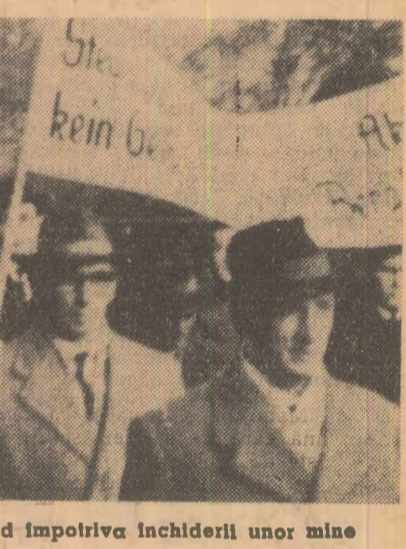
Demonstrație în orașul Dortmund împotriva închiderii unor mine

Din cercurile guvernamentale nu a parvenit nici o declarație cu privire la această problemă. Se pare că guvernul vrea să-și asigure o deplină libertate de acțiune în această chestiune. Se știe că unele țări membre ale Asociației europene a liberului schimb (A.E.L.S.) preferă reducerea restului suprataxei dintr-o dată și nu pe etape. Se pare însă că pe viitor soarta suprataxei va fi hotărîtă, tîndu-se exclusiv seama de interesele economice ale Angliei. Ministrul britanic al comerțului, la întoarcerea sa de la Geneva, a repetat că guvernul consideră pe mai departe suprataxa ca fiind o măsură trecătoare, la care se va renunța cît mai repede posibil.”