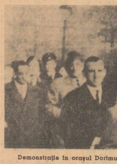
Demonstrație în orașul Dortmund împotriva închiderii unor mine

În februarie — continuă ziarul — extracția de cărbune brun a scăzut cu la 12,21 milioane tone la 11,25 milioane tone. Și producția de cocs s-a redus de la 3,27 la 2,96 milioane tone. Rezervele de cocs însumate acum 1,10 milioane tone, iar cele de cărbune brun — 9,35 milioane tone. În acest fel numai cantitățile