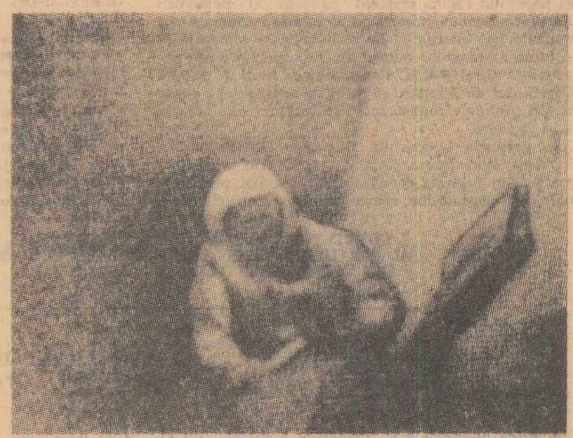
Locotenent-colonelul Leonov, pilotul secund al navei „Voshod-2”, în timp ce își efectuează programul de cercetări în cabina spațiului cosmic

În timpul zborurilor viitoare vor putea oare cosmonauții să părăsească navele îndepărtați de la o distanță de peste 5 m? — a întrebat unul din ziaristi. „Aceasta nu este o distanță limită”, a răspuns cosmonautul Pavel Popovici. „În viitor, noi vom putea renunța la cordonul cu care cosmonautul este legat de navă. Un motor rachetă cu o capacitate nu prea mare va per-