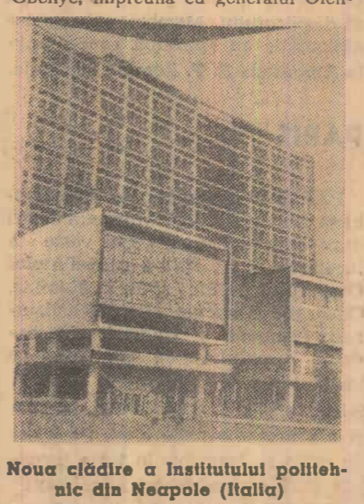
Noua clădire a Institutului politehnice din Neapole (Italia)

LONDRA. Ministerul Apărării al Marii Britanii a anunțat că la 30-31 martie va avea loc la Londra cea de-a 16-a sesiune a Comitetului militar al C.E.N.T.O. (Organizația tratatului central).