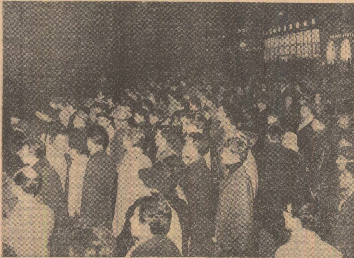
În fața sedului Comitetului Central al partidului după aflarea știrii despre incetarea din viață a tovarășului Gh. Gheorghiu-Dej

La ora cînd închidem ediția, pe adresa C.C. al P.M.R., Consiliului de Stat și Consiliului de Miniștri continuăm să sosească mii de mesaje din întreaga țară.