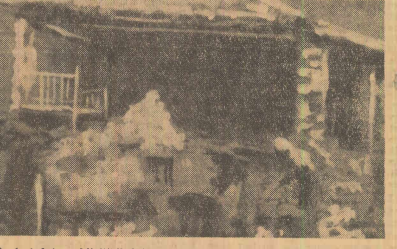
Au fost date publicității datele definitive ale pagubelor produse de recentul cutremur de pămînt care a avut loc în Grecia: 3.500 de case au fost complet distruse, iar alte 5.500 sînt grav avariate. Numărul morților se ridică la 17, iar al răniților la 217. Raportul arată că aproximativ 30.000 de persoane au rămas fără adăpost. Guvernul grec a anunțat miercuri că va participa la construirea a 10.000 de case noi. Fotografia înfățișează locuințe rulate într-o localitate din provincia Arcadia

PARIS. Într-un comunicat dat publicității joi de Banca Franței se anunță hotărîrea acesteia de a reduce taxa de scont de la 4 la 3,5 la sută. Potrivit agenției France Presse, această hotărîre a fost luată de Consiliul General al Băncii Franței.