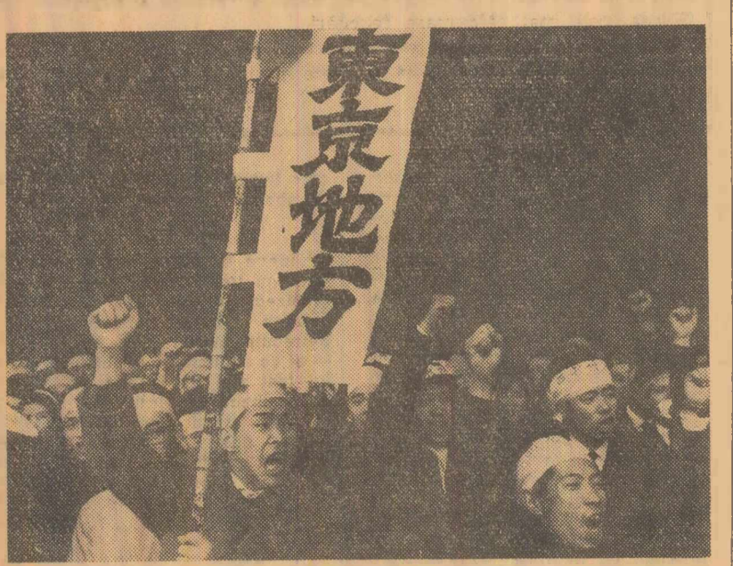
La Tokio a avut loc o ședință a conducerii Consiliului general al sindicatelor din Japonia (S.O.H.Y.O.) care reunește în rîndurile sale peste patru milioane de oameni ai muncii. Au fost examinate problemele privind desăgurarea ofensivei de primăvară a oamenilor muncii din Japonia și lupta împotriva agresiunii americane din Vietnam. Consiliul general a hotărît să organizeze în capitala Japoniei și în alte orașe manifestații de protest împotriva acțiunilor agresive ale S.U.A. în Vietnam. În clipse: demonstrație muncitorească la Tokio

lor Nguyen Cao Ky, șeful aviației sud-vietnameze, și Nguyen Khanh Thi, comandantul primei regiuni tactice, s-au desolidarizat de comandantul lor, deoarece acesta ar fi rămas fidel fostului comandant șef al armatei, Nguyen Khanh, în prezent „ambasador cu misiune specială”. Într-o știre de ultimă oră se arată că, în urma noii situații intervenite la Saigon, dr. Phan Huy Quat, șeful guvernului, s-a reîntors în capitală, venind din provinciile vestice ale Vietnamului de sud, unde efectua o vizită de inspecție.