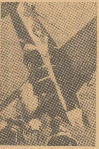
Avion american doborât în timpul unui raid deasupra R. D. Vietnam

● La Essen, unul dintre cele mai mari centre industriale din Ruhr, a avut loc o demonstrație de protest împotriva acțiunilor agresive ale S.U.A. în Vietnam. După demonstrație sute de locuitori ai orașului au participat la un miting convocat de organizația vest-germană „Campania pentru dezarmare”.