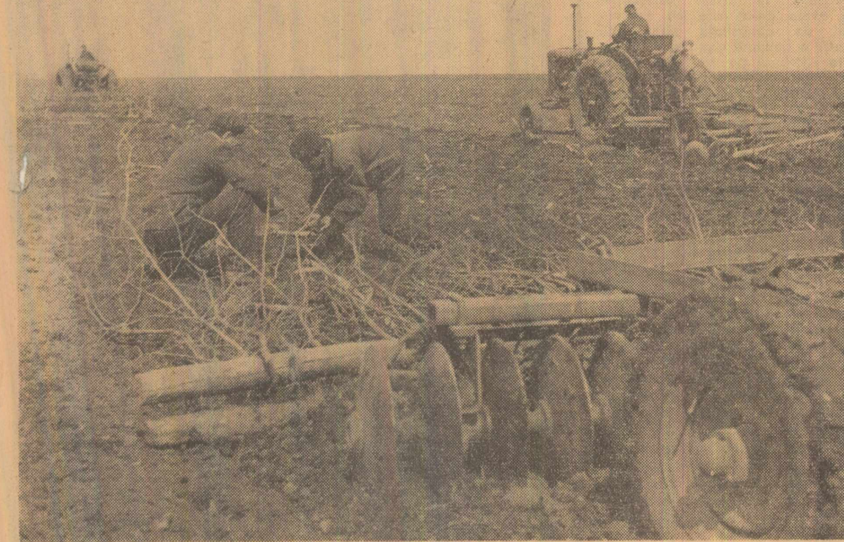
Pregătirea terenului în vederea însămîntării porumbului la cooperativa agricolă Plopoșoru, raionul Giurgiu.

În cursul acestui trimestru, la Galați își va începe activitatea și o modernă fabrică de produse lactate, cu o capacitate de prelucrare de 800 hectolitri lapte în 24 de ore.