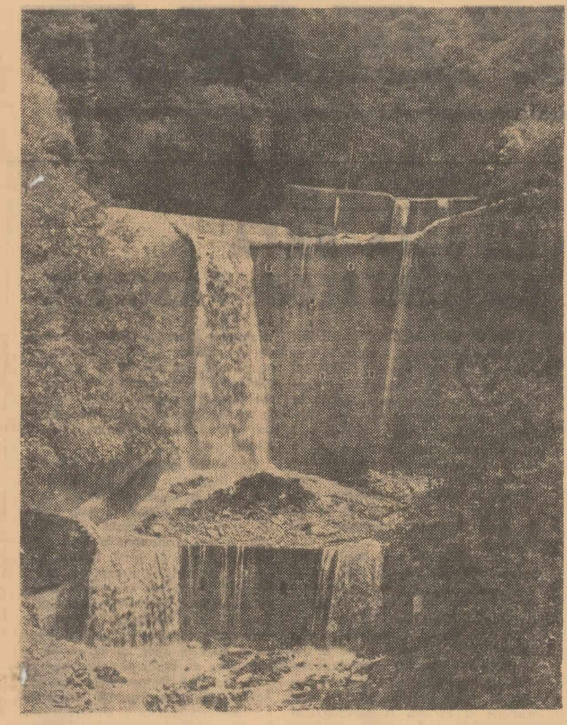
In văile munților, dealurilor și în alte locuri din țară, împotriva acțiunii de degradare a terenurilor de către torenți care își sapă albișii, se revarsă în locurile largi, depun aluviuni și aduc pagube...