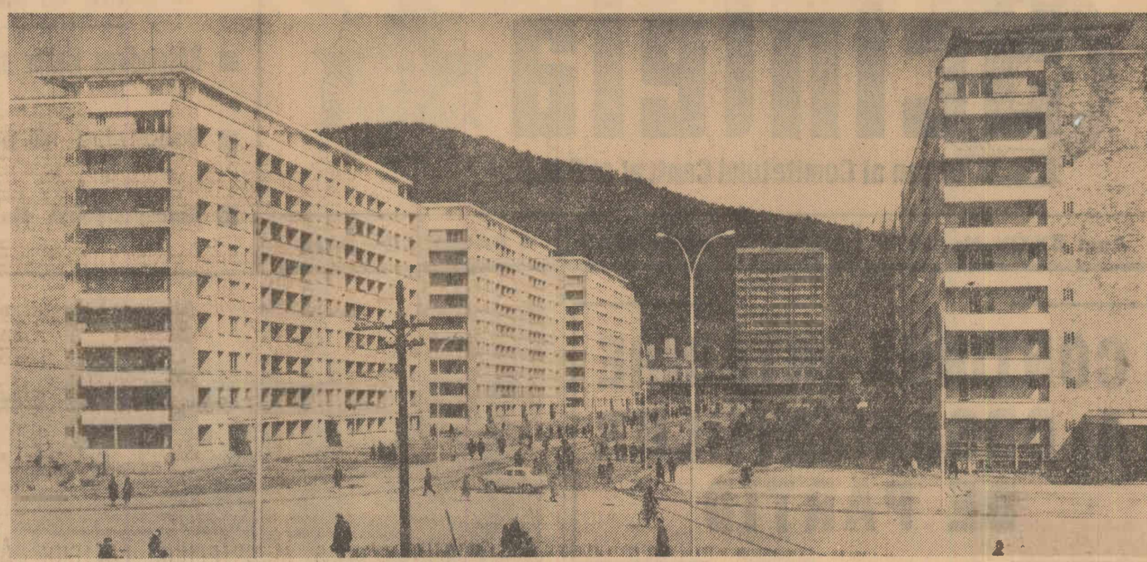
PIATRA NEAMȚ (coresp. „Scînteii”). — Constructorii de pe șantierul de locuințe din orașul Piatra Neamț au dat în folosință alte două blocuri. Este vorba despre cele 153 de apartamente înălțate pe strada Bicăzului și pe Bicăzului Chimiei, care sînt a patrulea etapă a lucrărilor. Cu acestoc numărul apartamentelor date în folosință în ultimii doi ani în orașul de pe poalele Coziei se ridică la 1.213. În acest an vor mai fi date în folosință încă 472 de apartamente care se vor construi pe străzile Alexandru cel Bun, Bicăzului și pe Bulevardul Chimiei. În fotografie: noul centru al orașului Piatra Neamț.