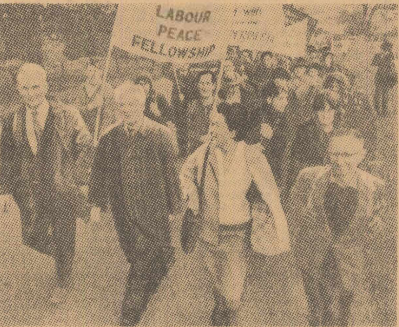
John Horner, Emrys Hughes, Anne Kerr și Frank Allau, membri laburisti ai parlamentului britanic, s-au aflat în fruntea marșului inițiat de organizația Campana pentru dezarmare nucleară

NEW YORK 20 (Agerpres). — După cum anunță agenția Tanig, țările în curs de dezvoltare au prezentat, în cadrul sesiunii Consiliului O.N.U. pentru comerț și dezvoltare, un program comun de acțiune destinat asigurării aplicării hotărîrilor Conferinței Națiunilor Unite pentru comerț și dezvoltare de la Geneva. Expunerea programului a fost făcută, în numele grupului de țări, de reprezentantul Iugoslaviei. Dintre elementele de bază ale programului, unele se referă la procedura pentru asigurarea progresului în domeniul colaborării economice; programul relevă problemele ce trebuie discutate în viitor la întrunirile Consiliului, pe linia ridicării economice a țărilor în curs de dezvoltare.