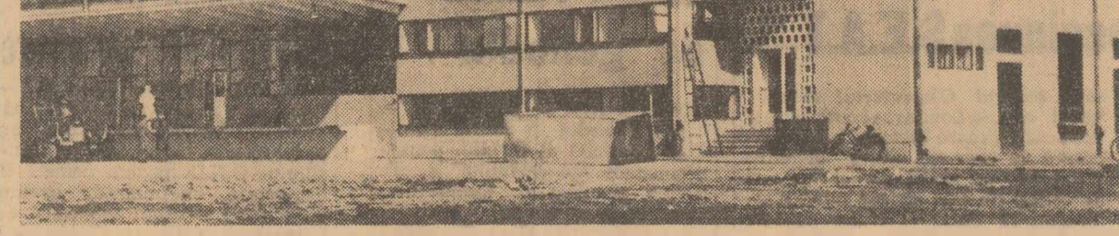
Întrată în funcțiune în ultimele zile ale anului trecut, fabrica de produse lactate din orașul Satu Mare (fotografia de mai sus) se adaugă celorlalte obiective apărute în anul șezălului pe harta industrială a regiunii Maramureș. Dotată cu mașini și instalații moderne, fabrica are o capacitate de prelucrare de 70.000 litri de lapte și produse lactate pe zi. Întregul proces de producție este mecanizat sau automatizat.

De-a lungul anilor, Partidul Muncitoresc Român și-a întărit continuu rîndurile, a dobîndit o bogată experiență politică și organizatorică, și-a perfecționat nelncetat metodele și metodele de muncă. Îndeplinirea sarcinilor trasate în acest domeniu de Plenara C.C. al P.M.R. din aprilie 1965 va contribui la creșterea competenței organizațiilor de partid în rezolvarea problemelor complexe care le stau în față, la sporirea forțelor lor de mobilizare a maselor. În întîmpinarea Congresului partidului, oamenii muncii își sporesc eforturile pentru obținerea de noi victorii în desăvîșirea construcției socialiste, în înflorirea patriei.