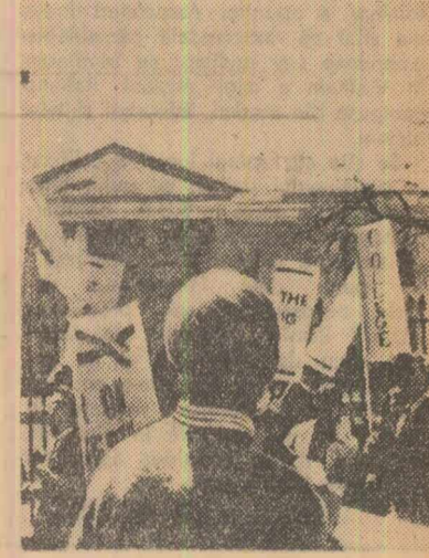
Pichete studențești în fața Casei Albe

În ultima vreme s-au semplat numeroase acțiuni ale unor studenți ai universităților americane, printre care și pichetarea de bănci naționale, a declarat în mod oficial Saxon, erau legate de încercările flagrante din partea unuia sau mai multor oficialități de bancă. Controlorul financiar James J. Saxon a declarat recent că, din 1951, au dat faliment 61 de bănci. Toate cele nouă falimentate de bănci naționale, a declarat în mod oficial Saxon, erau legate de încercările flagrante din partea unuia sau mai multor oficialități de bancă. Subcomitetul, condus de senatorul John McClellan, din Arkansas, încearcă să stabilească de ce au dat faliment atît de multe bănci. Audierile vor fi reluate la 20 aprilie. Controlorul financiar James J. Saxon a declarat recent că, din 1951, au dat faliment 61 de bănci. Toate cele nouă falimentate de bănci naționale, a declarat în mod oficial Saxon, erau legate de încercările flagrante din partea unuia sau mai multor oficialități de bancă.