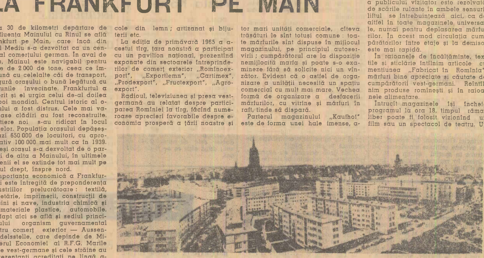
Frankfurt pe Main în reconstrucție

La 30 de kilometri depărtare de confluența Mainului cu Rinul se află Frankfurt pe Main, care încă din Evul Mediu s-a dezvoltat ca un centru al comerțului german. În aval de oraș, Mainul este navigabil pentru nave de 2 000 de tone, ceea ce împunează ca celălalte căi de transport, asigură orașului o bună legătură cu regiunile învecinate. Frankfurtul a sursit și el urgența celor de-al doilea război mondial. Centrul istoric al orașului a fost distrus. Cele mai valoroase clădiri au fost reconstruite. Clădirea noi s-au ridicat în locul ruinelor. Pe populația orașului depășește azi 650 000 de locuitori, cu aproximativ 100 000 mai mult ca în 1939. Deși orașul s-a dezvoltat de o parte și de alta a Mainului, în ultimele decenii el se extinde tot mai mult pe malul drept, înapre nord. Importanța economică a Frankfurtului este întregită de preponderența industriei prelucrătoare: textilă, papetărie, imprimărie, construcții de mașini și nave, industria chimică și de materiale plastice, automobile. De fapt aici și sediul principalului organism guvernamental pentru comerț exterior — Aussenhandelsstelle, care depinde de Ministerul Economic al R.F.G. Marile firme vest-germane și cele străine au reprezentanți acreditați pe lângă acest oficiu.