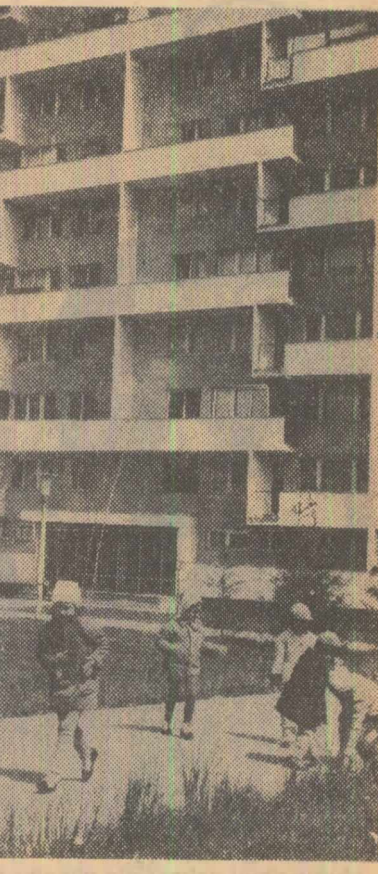
„Și toți au venit primăvara