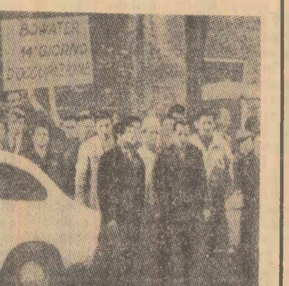
ROMA. De cîțva timp muncitorii fabricii de cartonaje aparținînd societății engleze „Bowater” au ocupat întreprinderea (fotografia de mai sus). Ei au recurs la această formă a luptei greviste în semn de protest împotriva intenției proprietarilor acestei întreprinderi de a o închide. Autoritățile judiciare au cerut muncitorilor să elibereze fabrica.

WASHINGTON. Comisia pentru energie atomică a S.U.A. a anunțat că miercuri, la poligonul din Nevada, a fost efectuată o nouă explozie atomică subterană. Aceasta este cea de-a opta experiență anunțată de Statele Unite de la începutul anului.