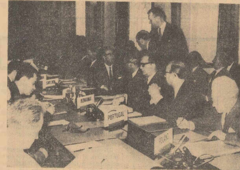
La sesiunea Comisiei economice a O.N.U. pentru Europa.

Intr-un comentariu transmis din Caracas, agenția France Presse scrie, citind cereri apropiate de Ministerul pakistanez al Afacerilor Externe, că „poziția Pakistanului în problema vietnameză este mai apropiată de cea a Franței decît de cea a Statelor Unite”, în urma hotărîrii franceze de a trimite numai un observator la sesiunea Consiliului S.E.A.T.O. de la Londra. Aceleași cereri au menționat că guvernul pa-