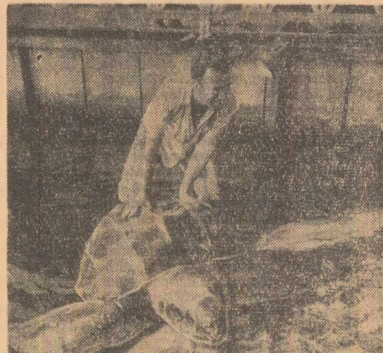
La Rio de Janeiro, în locul de pe litoral denumit „Barra dos pescadores”, a apărut o broască (fotoasă de proaspăt neobșnuite: 1,80 m lungime și 850 kg greutate. Specialiștii au apreciat că vârsta ei ar fi de circa 500 de ani. După ce a fost vizitată de o mulțime de curioși, cineva a organizat o colecție pentru a plăti pescarilor s-o reducă în ocean, dar între timp broasca a murit.

Între 24 iunie și 4 iulie se va desfășura la Oxford un festival Bach, în cadrul căruia vor avea loc 27 de concerte. La festival vor lua parte și cîteva orchestre străine, precum și dirijorii și solistii de frunte britanici și străini. Printre lucrările muzicale care vor fi interpretate în timpul festivalului figurează 15 cantate ale lui Bach și alte opere ale marelui compozitor.