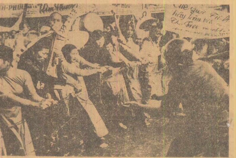
Pături tot mai largi ale populației sud-vietnameze participă la lupta împotriva regiunii marionete a Saigonului. În fotografie: Poliița împraștie cu forța o demonstrație a budiştilor din capitală