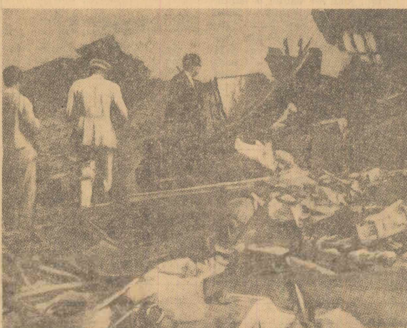
Muncitorii, studenții, juriștii au participat la Tokio la un mare miting împotriva violărilor aduse constituției și pentru drepturi democratice