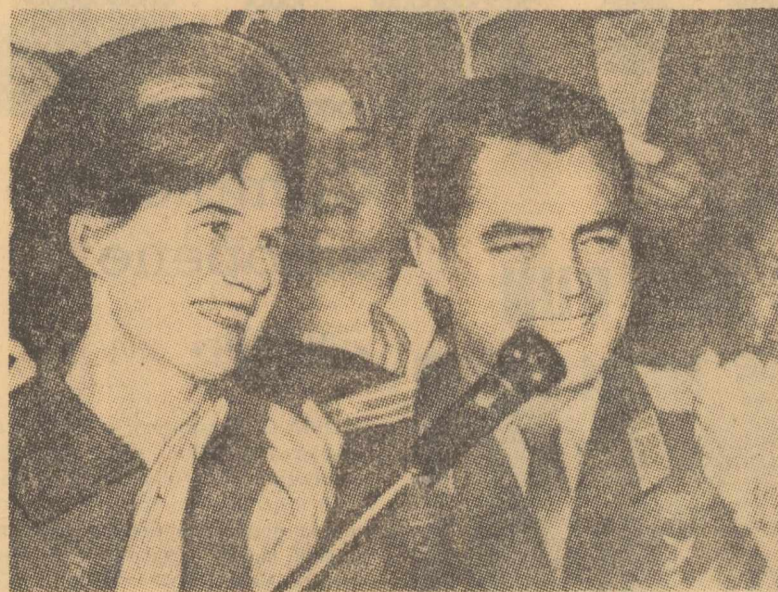
În cursul vizitei lor în Franța, cosmonauții sovietici, soții Valentin Nikolaev Tereșkova și Andrian Nikolaev, au primit numeroase dovezi de simpatie din partea populației

PARIS. Președintele de Gaulle și-a încheiat duminică vizita prin câteva departamente ale Franței. După cum apreciază agenția France Presse, campania electorală în vederea viitoarelor alegeri prezidențiale este practic deschisă. Dar, a-