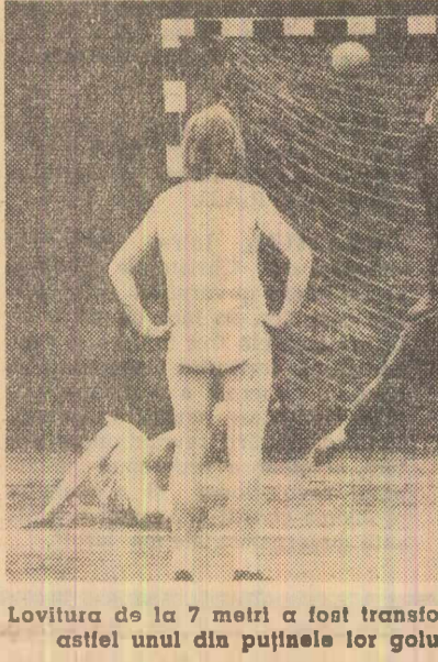
Loturile de la 7 metri a fost transformată. Studențele clujene au înscris astfel unul din puținele lor goluri în meciul cu Știința București

HANDBAL: masculin: Știința Galați—Voința Sighisoara 25—16, Dinamo Braşov—Steaua București 14—14, Știința Petroșeni—Tractorul Braşov 21—19, Dinamo Bacău—Știința Timișoara 16—8, Știința Tg. Mureș—Dinamo București 11—30; feminin: Știința București—Știința Cluj 12—3, Confecția București—S.S.E. Ploiești 32—4, Tractorul Braşov—Șc. Medic nr. 4 Timișoara 18—9, Știința Timișoara—Mureșul Tg. Mureș 6—4, C.S.M. Sibiu—Rapid București 8—14.