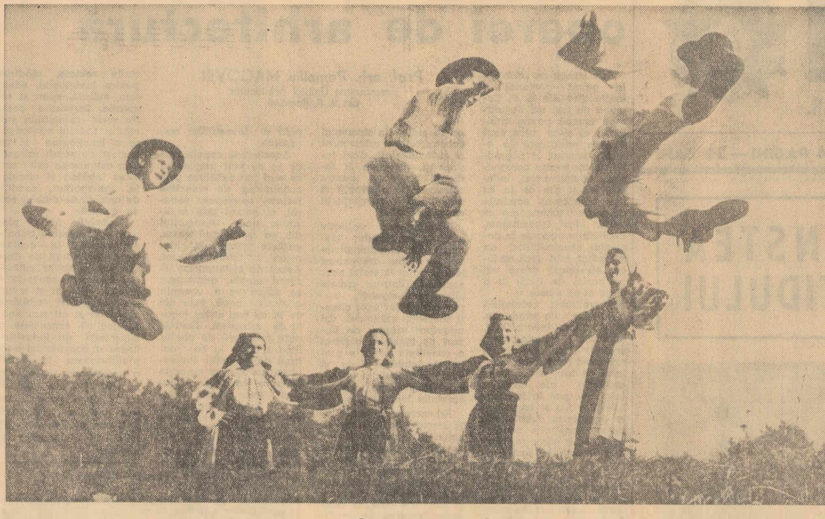
În viltorea dansului