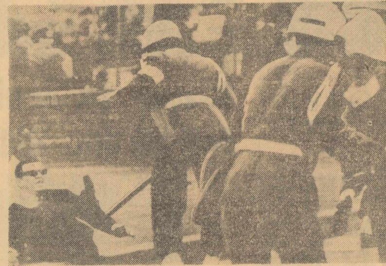
În Columbia a fost decretată starea de asediu pentru a se împiedica demonstrațiile de protest față de intervenția S.U.A. în Republica Dominicană. La Bogota au avut loc noi ciocniri între poliștii și studenții care manifestau împotriva declarației stării de asediu