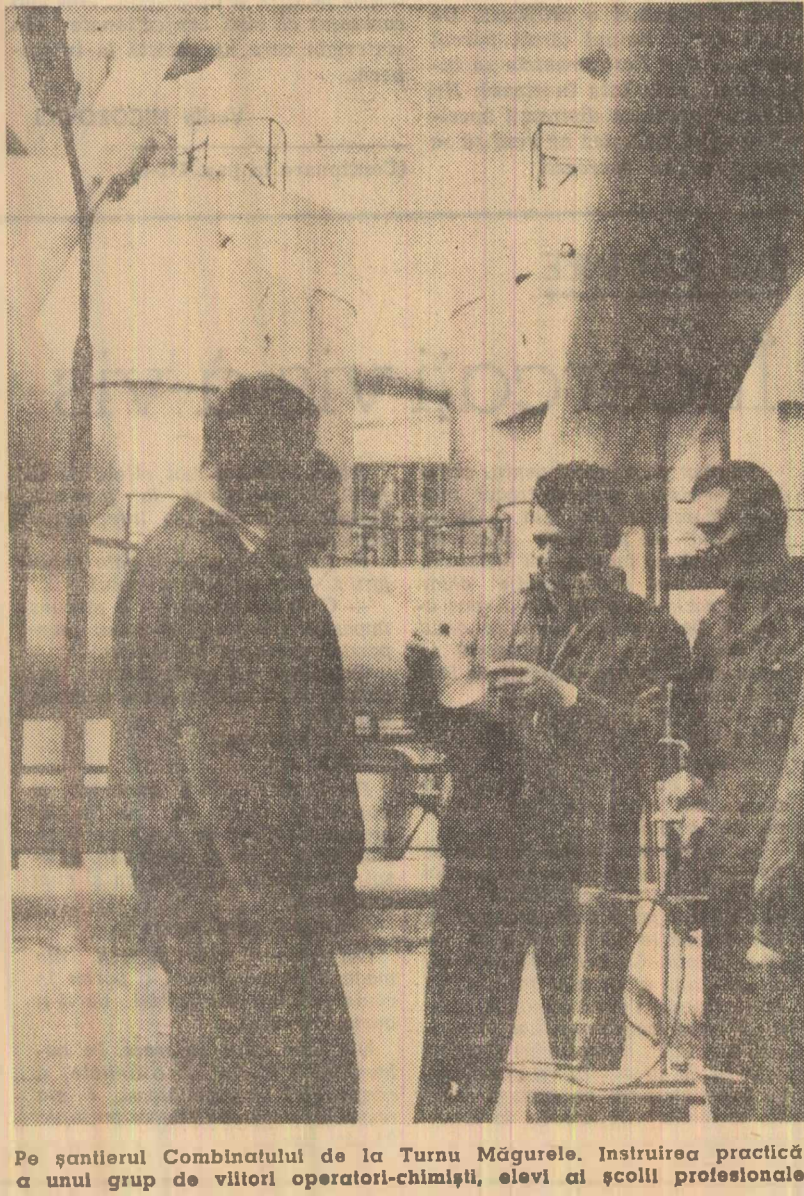
Pe școlarul Combinatului de la Turnu Măgurele. Instruirea practică a unui grup de viitori operatori-chimiciști, elevi ai școlii profesionale