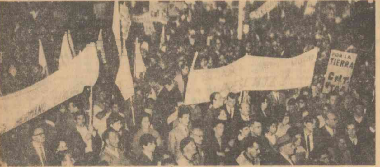
După un marș îndelungat, numeroși cultivatori de țesle din Arligas, provincie din nordul Uruguayului, au sosit, cu familiile lor, la Montevideo pentru a cere gu vernului să le distribuie terenuri necultivate

CARACAS. În regiunile muntoase din Venezuela au avut loc puternice lupte între trupele guvernamentale și detașamente de partizani.