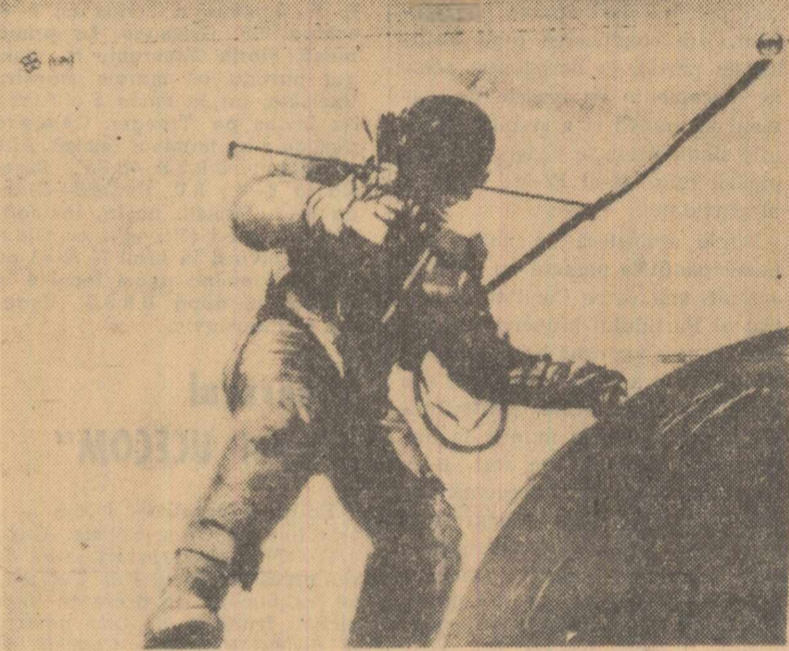
Astăzi, cosmonauții americani J. McDivitt și E. White sosesc la centrul spațial din Houston. Posturile de televiziune din S.U.A. au reprodus filmul în culori înfățișînd evoluțiile lui White în spațiul cosmic.

Potrivit unei știri transmise de agenția France Presse din Lisabona, în cursul serii de marți Chombe a sosit în capitala portugheză cu un avion militar portughez. Cenzura din Lisabona nu a autorizat ziarele să menționeze știrea. În cursul dimineții de miercuri, cenzura a fost ridicată, iar postul de radio național a anunțat la orele 12 (G.M.T.) următoarele: „Primul ministru al Congoului, Moise Chombe, a trecut prin Lisabona. El a fost primit de președintele Consiliului” (Salazar). Lovitura de teatru s-a produs