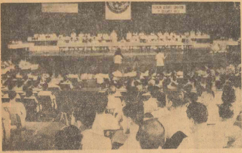
SINGAPORE. Miting al partidelor de opoziție împotriva politicii partidului de guvernământ din Malaysia

Cu o noapte înainte de ceremonie necunoscuti au scris pe zidurile caselor din regiunea Hougmont (Belgia): „Hastings 1066-1966”, pentru a aminti victoria normanzilor asupra englezilor.