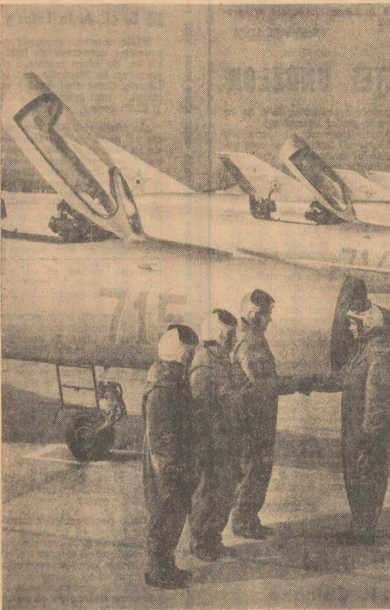
Misiunea de zbor a fost îndeplinită

Ministrul Forțelor Armate ale R.P. Române General de armată LEONTIN SALAJAN