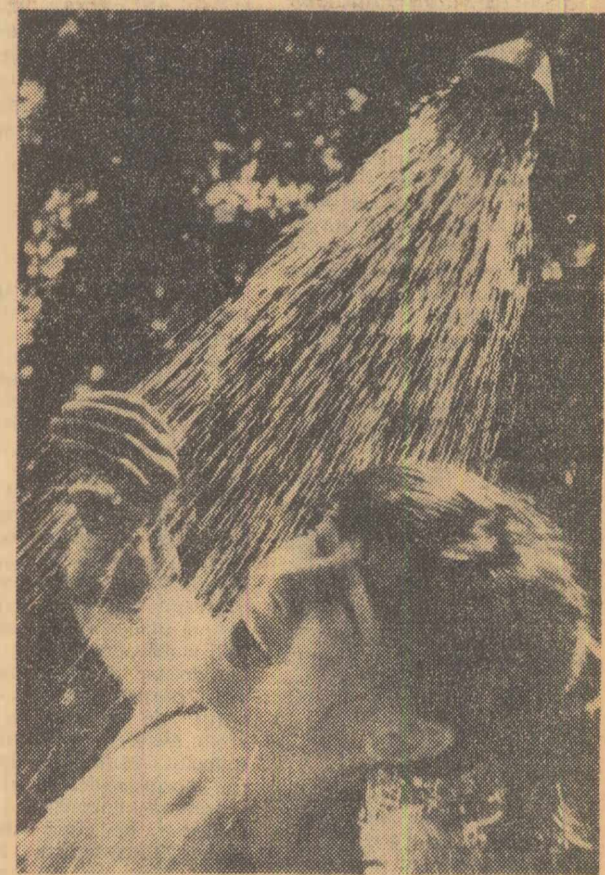
Ce bine e!...