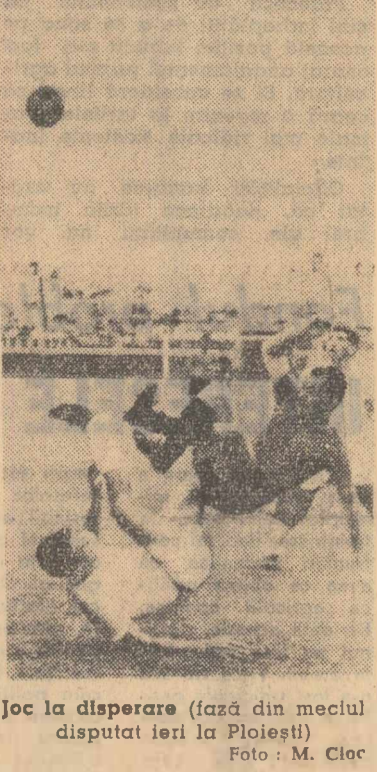
Joc la disperare (iază din meciul disputat ieri la Pitești)

Încă de la primele schimburi de mingi s-a văzut clar că echipa campioanelor privește cu ușurință partida.