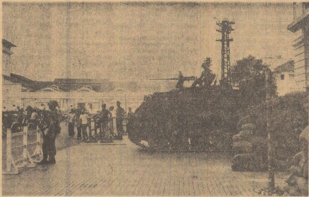
Tancuri și soldați ai trupelor guvernamentale sud-vietnameze patrulînd prin Saigon după declararea stării de război

Pentru prima dată primesc scrisori de la țărani — mi-a spus un jurnalist emoționat ziarist progresist. În felul lor, sînt vestitii ai zilelor de mîine.