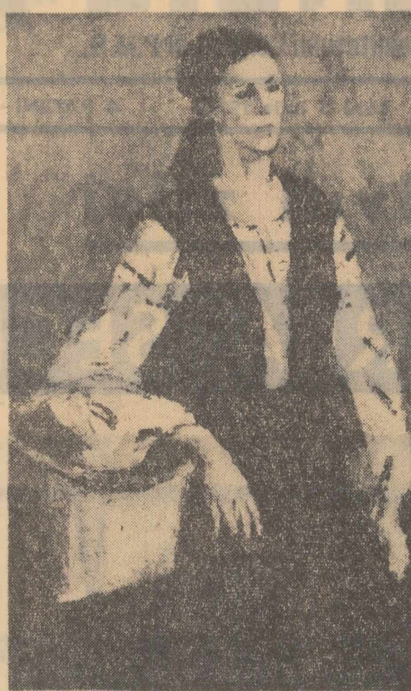
Două dintre lucrările lui H. Catargi aflate în expoziția personală a pictorului: „ȚARANCA CU COȘUL” (sus) și „NATURA STATICA” (jos)

Pentru ca un conțentativ ca Henri Catargi să fi putut ajunge la aceasta, este limpede că suferința sau a trebuit să se descopere adînc impregnat de transformările mediului. Catargi are nu numai crizele necesare ca să le recepțeze, ci și timbrul sufletesc corespunzător rezonanței lor lirice. Mulți artiști au abordat, o dată cu genul peisajului industrial, tema nouă a transformării aspectului naturii prin voința omului. Dar e rar să găsești un suflet atât de grandios (și de grandios fără nici o retorică, fără ostentație, prin simpla oglinzire și selecție a structu-