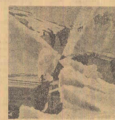
ELVEȚIA. Zăpezile care au căzut în acest an în Alpi au durat mai mult ca de obicei. Treacătoarea Klausen a fost printre cele din urmă care au fost redat circulației

DAMASC. La 4 iulie a sosit la Damasc o delegație economică a R. D. Germane care va purta tratative cu guvernul Republicii Arabe Siria în scopul dezvoltării colaborării economice, tehnice și culturale dintre cele două țări.