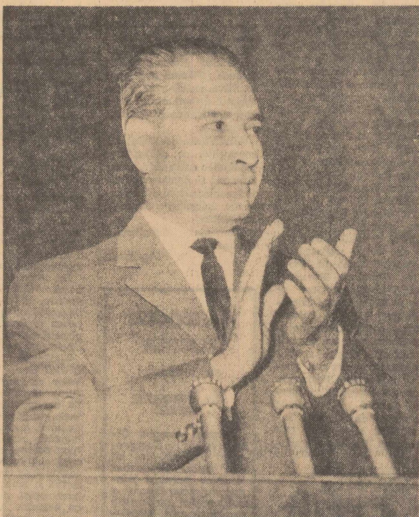
Învățăturii revoluționare despre partid — Partidul Muncitoresc Român a acționat întotdeauna ca un partid marxist-leninist. Pentru oamenii

țării capitaliste, pentru victoria socialismului pe întinsul patriei noastre, Republica Socialistă România. (Vii aplauze).