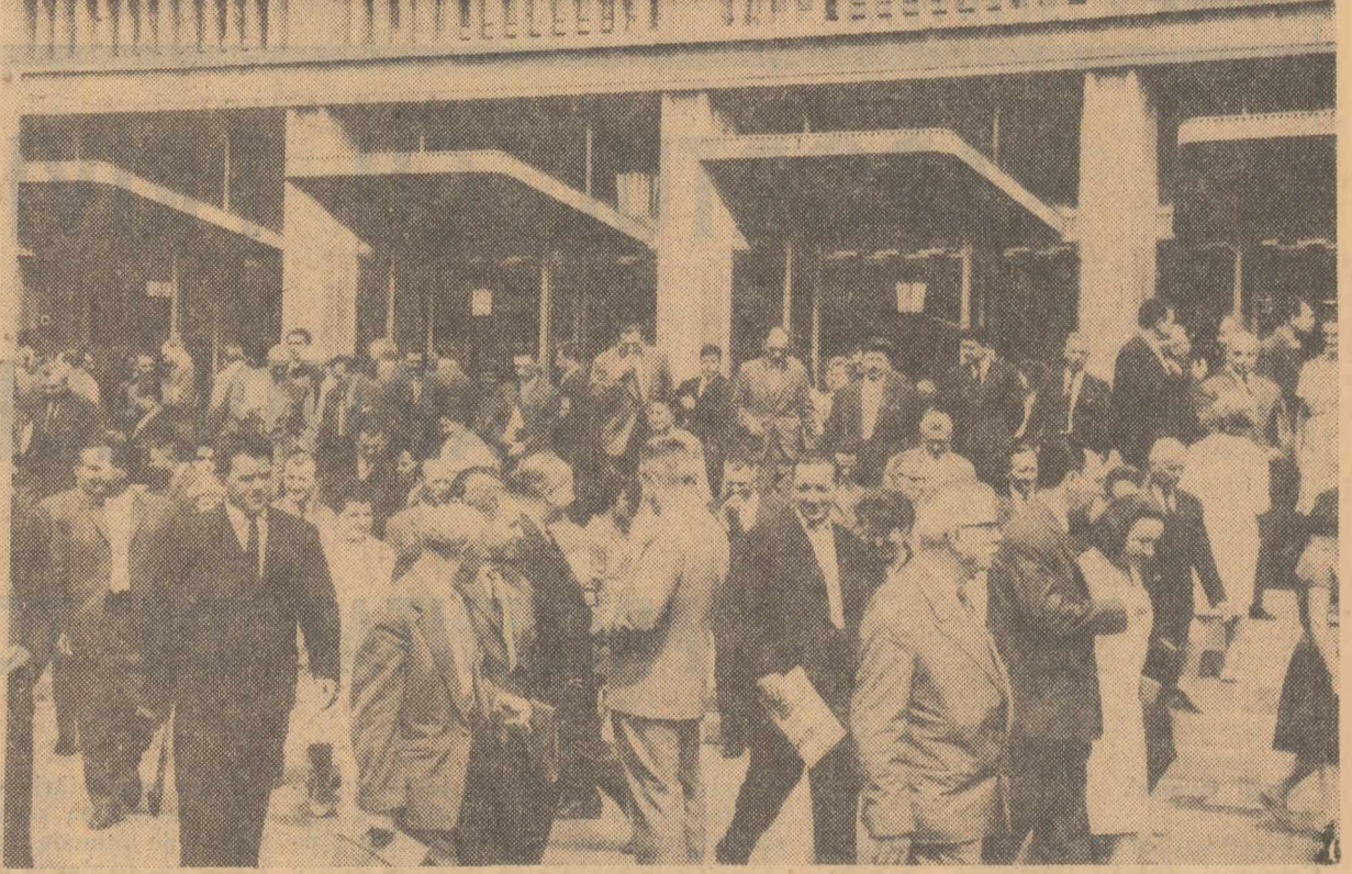
După încheierea unei ședințe

Raport asupra Direcțivelor Congresului al IX-lea al Partidului Communist Român privind planul de dezvoltare energetică. Lucrările au fost editate într-un tiraj de masă.