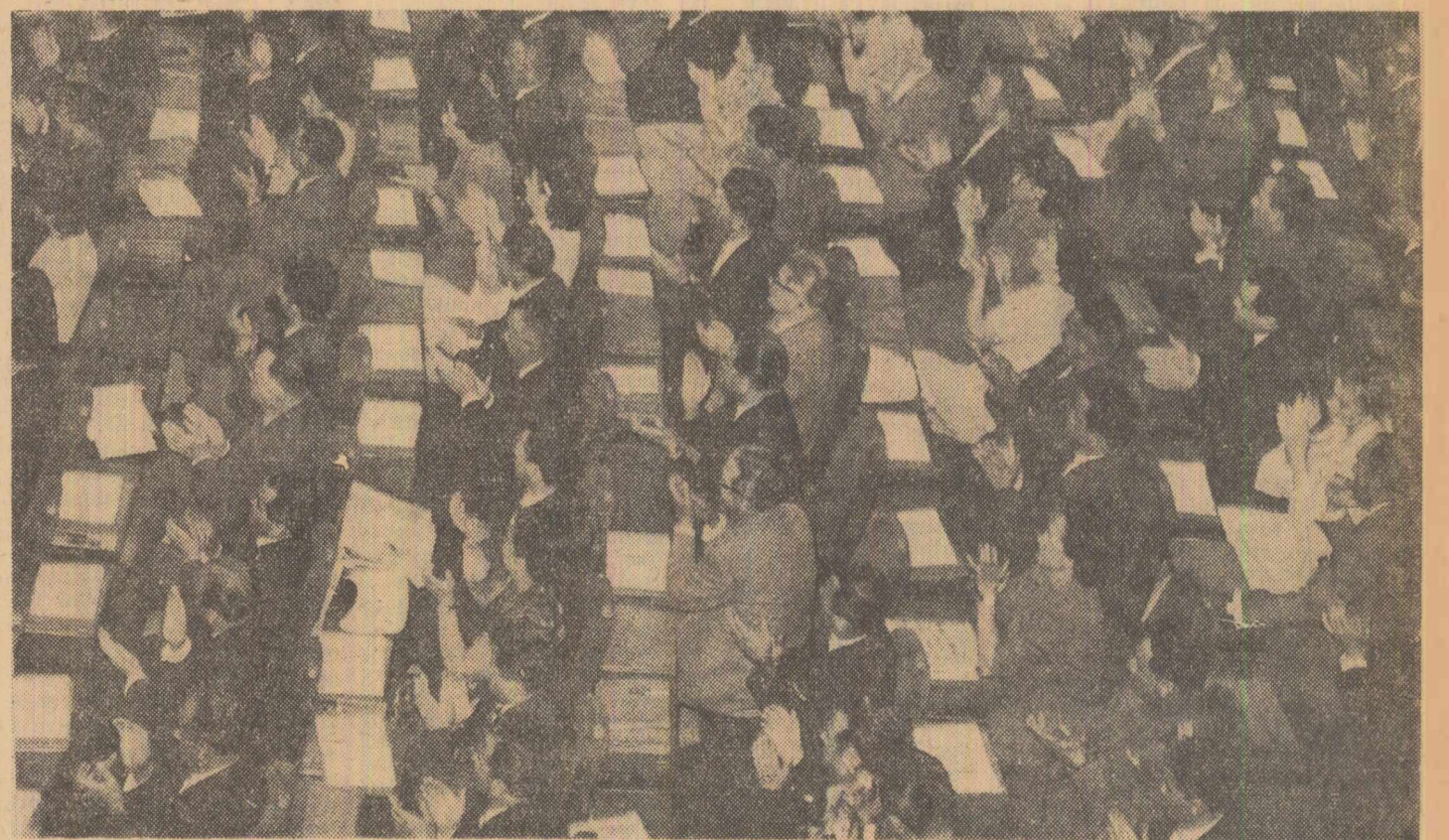
În timpul lucrărilor Congresului