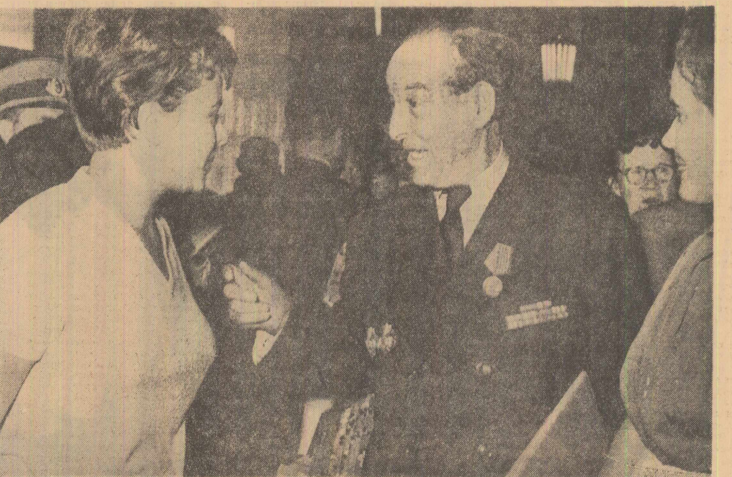
Delegați la Congres