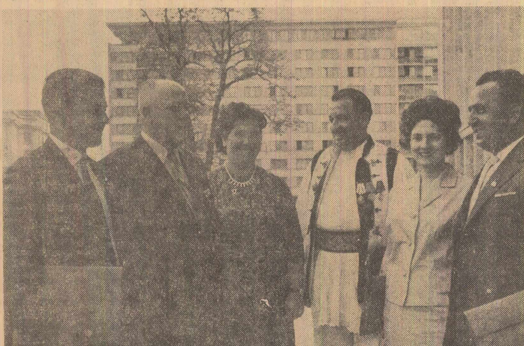
Un grup de delegații

În perioada la care se referă raportul Comitetului Central, partidul nostru a desfășurat o bogată activitate de