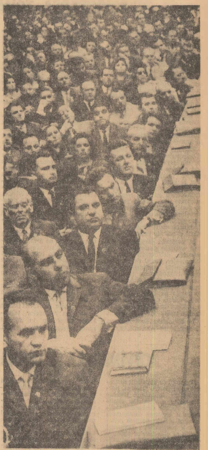
În sala Congresului

Dezbatînd proiectele de Directive, Plenara C.C.S., în numele tuturor membrilor de sindicat, și-a manifestat aprobarea unanimă față de prevederile lor și hotărîrea sindicatelor de a participa cu toate forțele lor la realizarea politicii născute a partidului și statului de industrializare socialistă a țării, pentru înflorirea și prosperitatea economiei noastre naționale.