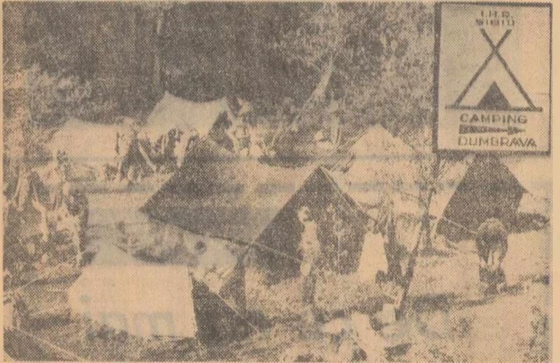
Turștii au poposit la campinul organizat în pădurea Dumbrava din vecinătatea Sibului.

Nici în organizarea interesanților la lecții criteriul principal nu este peste tot — așa cum e firesc — eficiența maximă. În unele școli are loc o adevărată competiție pentru cîm multe asemenea „activități” indiferențe de roadela pe care le dau. Tendința este alimentată nu o dată de către directorul de școală sau de către inspectorii, care se grăbesc să înscrie luga după canitele la capitolul „merite”. Cred, de asemenea, că este de dorit ca interesanții să nu fie lăsați doar la „inspirația” cadrelor didactice: „Marg la cine vreau”, „Asistă cînd îmi vine bine”. Consider că eficiența interesanților ar crește