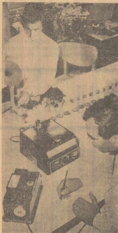
Stăruința experimentală hortivillacoală Minig din regiunea Banat. Se determină azotul și fosforul din sol și plantă