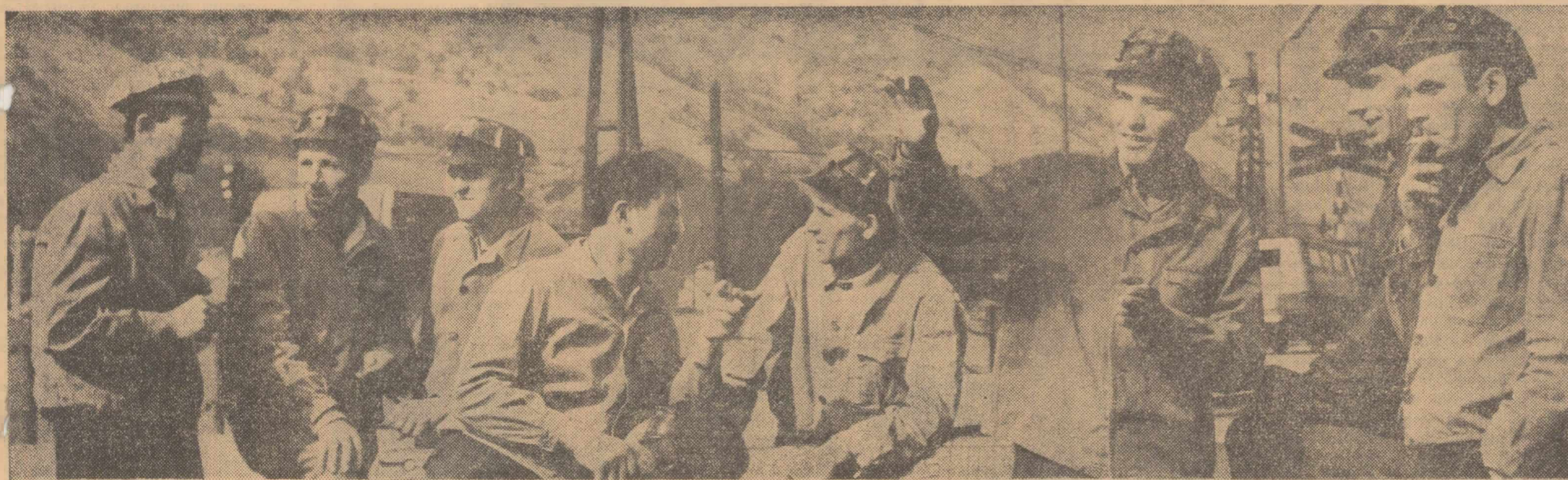
Schimb de păreri între mineri și exploatarea Petrii înainte de intrarea în șta