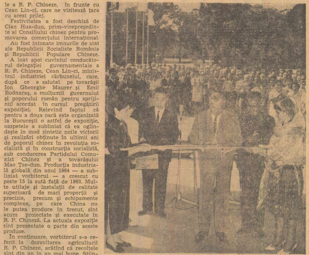
La inaugurarea expoziției