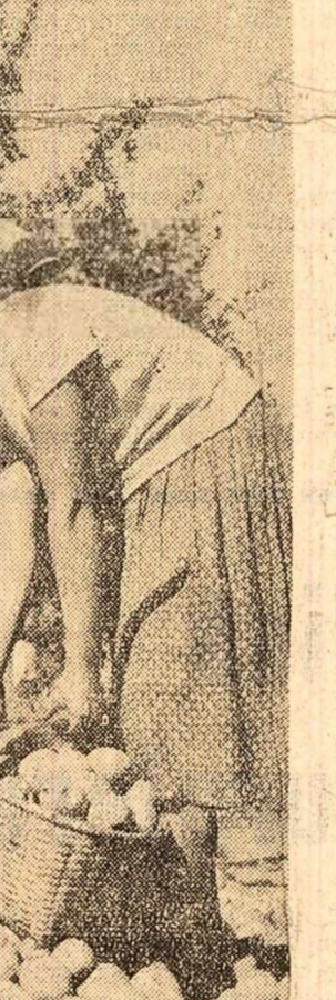
Imaginile lui... (Caption for the photograph)

Imaginile lui... (Continuation of text about images of a person)