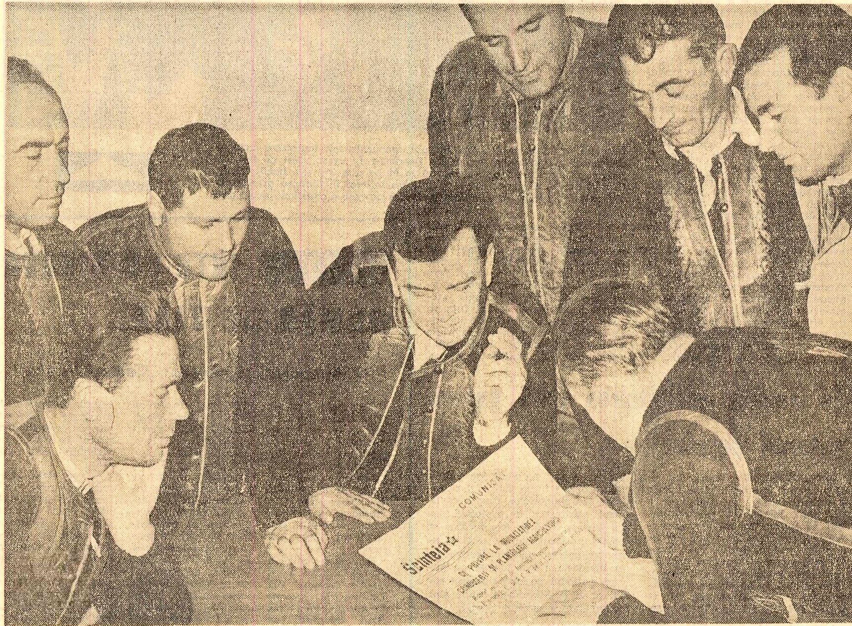
După primirea zărelor la cooperativa de producție agricolă Sohatu, regiunea București

Și pînă acum cooperatorii din Lețcani au inițiat unele acțiuni comune împreună cu membrii cooperativei agricole din Dumăști, unitate cu care ne învecinăm. Aceste acțiuni sînt un început bun, dar care trebuie consolidat și intensificat. Cooperind mai strîns pentru a realiza un sistem de irigație comun, am obținut rezultate incomparabil mai bune. Spre exemplu, am putea crea un bazin legumicol pe toată suprafața comunelor noastre pe o suprafață de 100 ha. Acesta se impune deoarece sîntem în zona deosebit de secetoasă, unde produsele legumicole sînt foarte mult cerute. Am căzut de acord să unificăm cele două grădini (37 ha la Lețcani și 22 ha la Dumăști) pe un teren potrivit situat la hotarul dintre aceste unități. Dacă fiind faptul că rețeaua electrică trece pe aproape, o cooperare mai strînsă între cooperativele noastre ar duce și la procurarea și folosirea în comun a unor electro-pompe cu care să tragem apă în orice colț de vie. Tot aici, împreună, am putea crea și un centru de sortare a strugurilor înfățișîndu-se producției să se facă mai bine și în condiții mai ușoare. Mă mai gândesc apoi și la executarea în comun a lucrărilor de arături și stoporii în vie, mergînd de-a lungul teraselor, fără a ne opri la hotar. În rezolvarea acestor probleme uniunile cooperativele ne vor putea acorda un sprijin prețios.