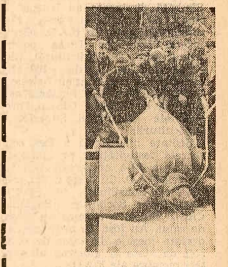
Dol pescari din R.D.G. au prins în Marea Baltică o broască țoasă lungă de peste 2 metri și avînd o greutate de 450 kg. Ea a fost predată grădinii zoologice din Leipzig