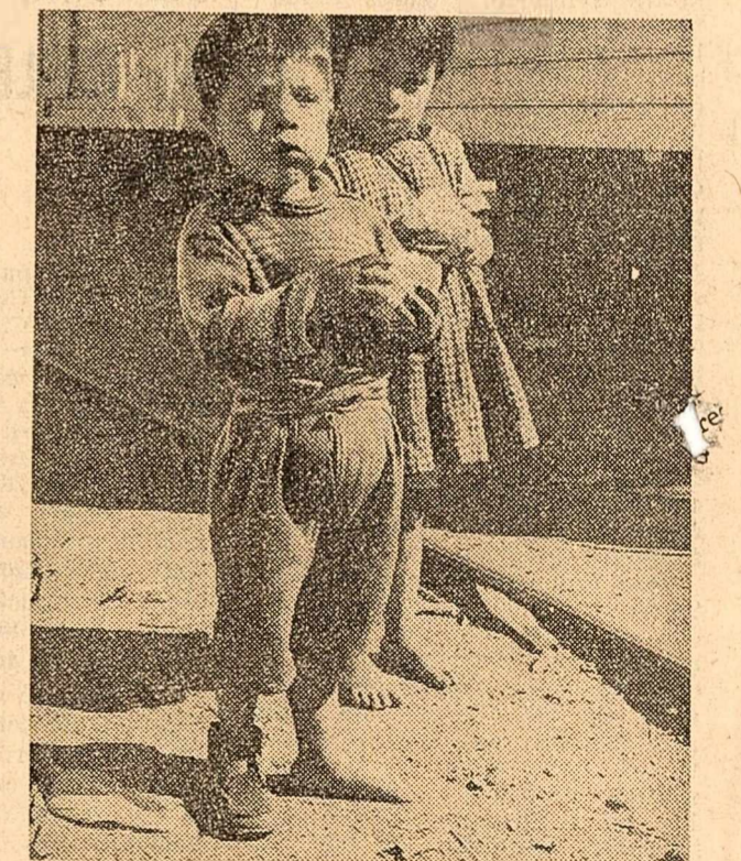
Aspect cotidian pe străzile capitalei peruviene: copil cerșind. Sînt doar doi din cei cinci milioane de copii din această țară care suferă din cauza subalimentației