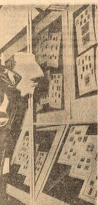
Cu ocazia „Zilei mărcii poștale românești” a fost deschisă — în holul Poștelor Centrale — o expoziție filatelică

În articolul „Discul și cultura muzicală” apărut în „Șcinteia” nr. 6.666, se arată că, în lumina exigențelor actuale, activitatea Casei de discuri „Electrodisc” vadește încă unele lipsuri în promovarea muzicii simfonice, de cameră și de operă, precum și în popularizarea discului.