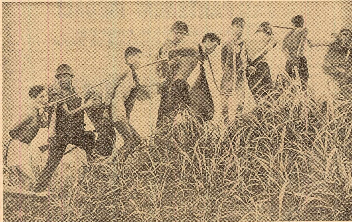
O imagine elocventă a mistunii „civilizatoare” a trupelor americane în Vietnamul de sud: cițiva patrioți cu mâinile încuțate și legați între ei cu o frînghie de giț sint împinși de pușcași marini spre locul suplicului. Zădarnic încearcă însă intervenționiștii să înăbușe lupta patriotică a populației sud-vietnameze. Forțele patriotice dau grele lovituri trupelor americano-salgoneze, în timp ce în S.U.A. se intensifică curentul de opinie împotriva singerosului război.